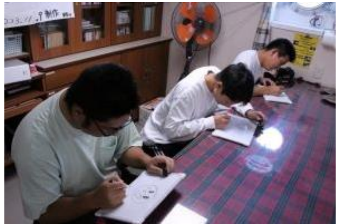
似顔絵ゲーム。伝説を残したのは誰だ！？