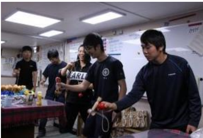
けん玉ゲーム！誰が一番だったのかな？