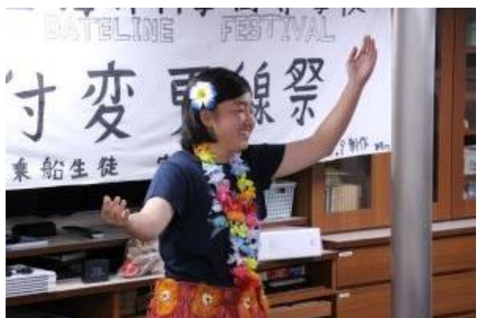
フラダンスショ～いい笑顔ですね～