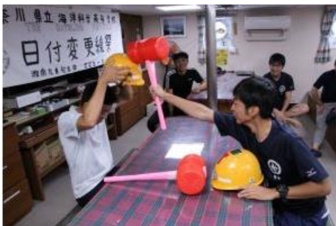
恒例のじゃんけん大会！