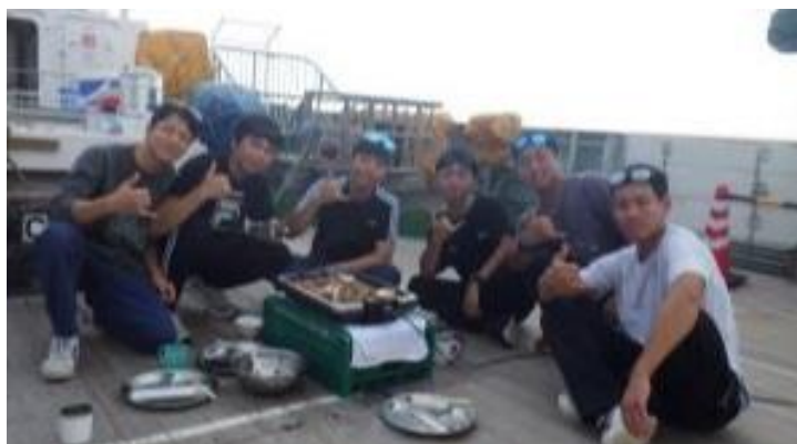
甲板上で行ったBBQの様子