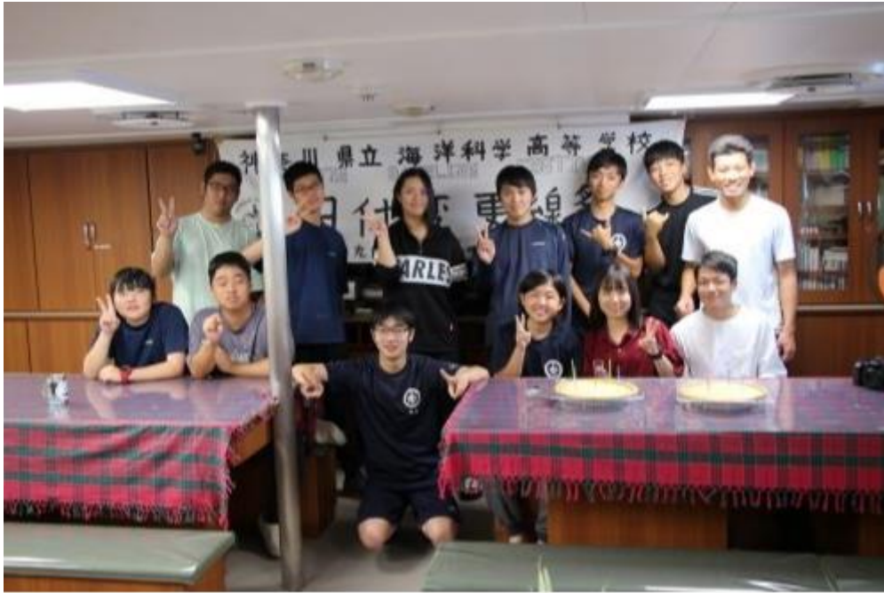
デイトライン祭 お疲れさまでした！