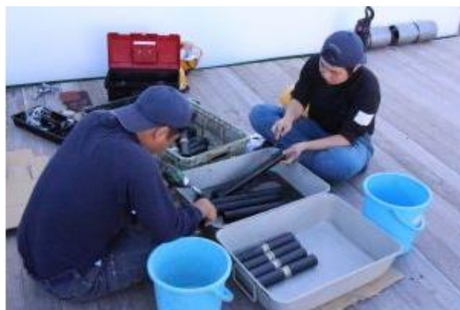
漁具の片づけ (E 専)