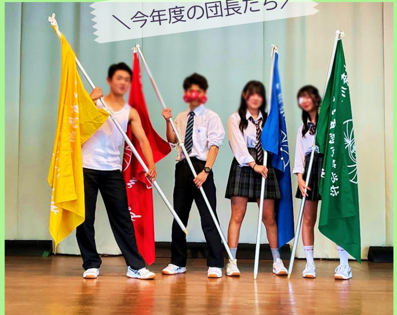
今年度の団長たち

生徒総会后、体育祭の結団式を行いました。赤団、青団、緑団、黄団それぞれの団長が全校生徒の前に立ち、体育祭に向けて意気込みを示しました。その後はグラウンドに移動し、各団ごとに円になり、団長や総務の方々が中心に団の絆を深めてくれました。