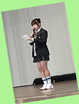
体育祭実行委員長