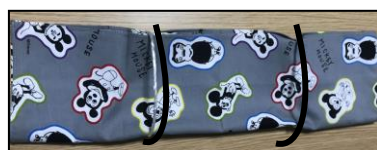
③ 3等分の位置にゴムを通す