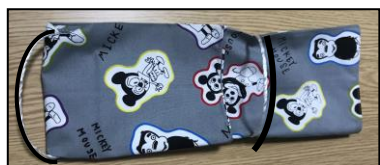
④ ゴムのところまでおる