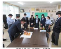
湘南大産/心の産校との連携 穂田製菓総務課【左】