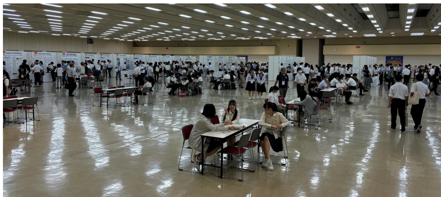
← 会場内の様子。 たくさん的高校生！

厚木高校からは今年度は3年生二人が「リモネンのシロアリ忌避効果に関する研究」という内容でポスター発表をしてくれました。2人はこの日のために、3年生になっても研究を続け、ポスター作成に励み、最後の最後まで発表練習に取り組みました。当日の発表でもうまく役割分担をしたり、聞いてもらえるよう声掛けをしたりと、とにかく全力でした。その結果、多くの方に聴いてもらいたくさんの質問やアドバイスをいただくことができたようです。二人の準備・発表の様子を見て、彼女たちの真面目さや底力を感じ、何より一生懸命な姿に感動しました。