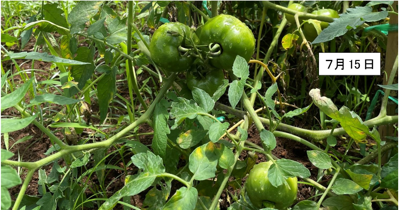
大きいトマトもできてる！ トウモロコシも！ 茄子の花も！