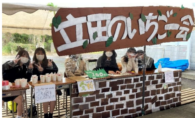
立田のいちご一会 🍓