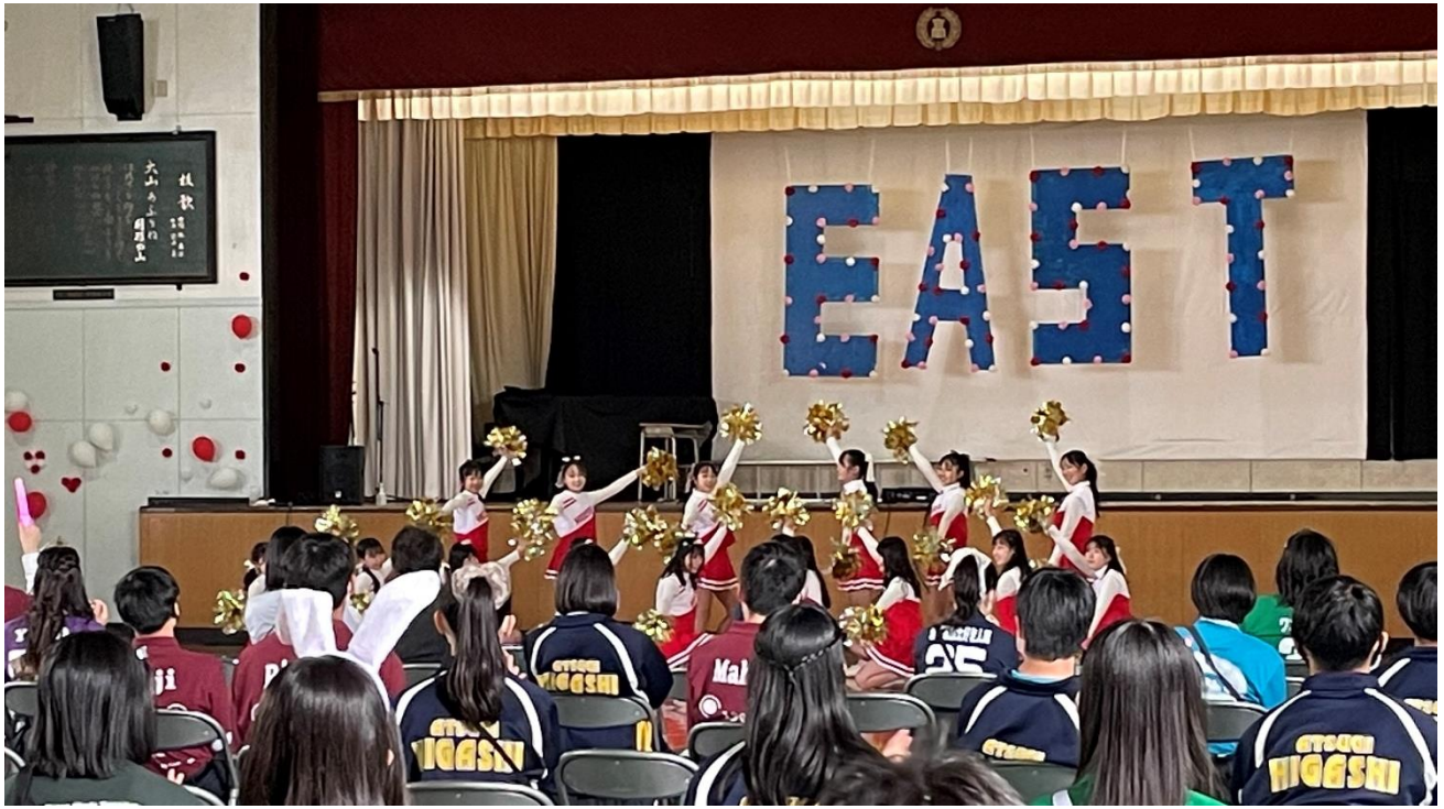
バトントワリング部