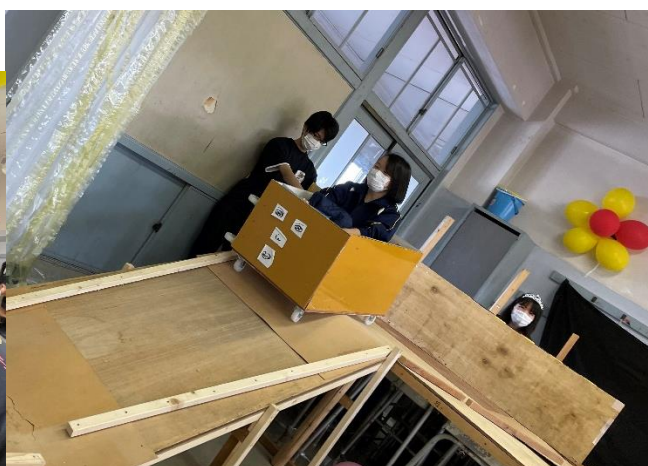
きしさんのハニーハント