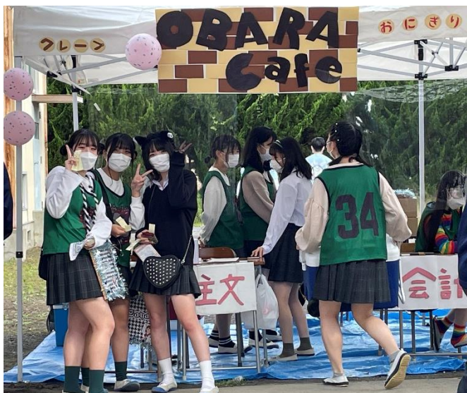
OBARA Caf é