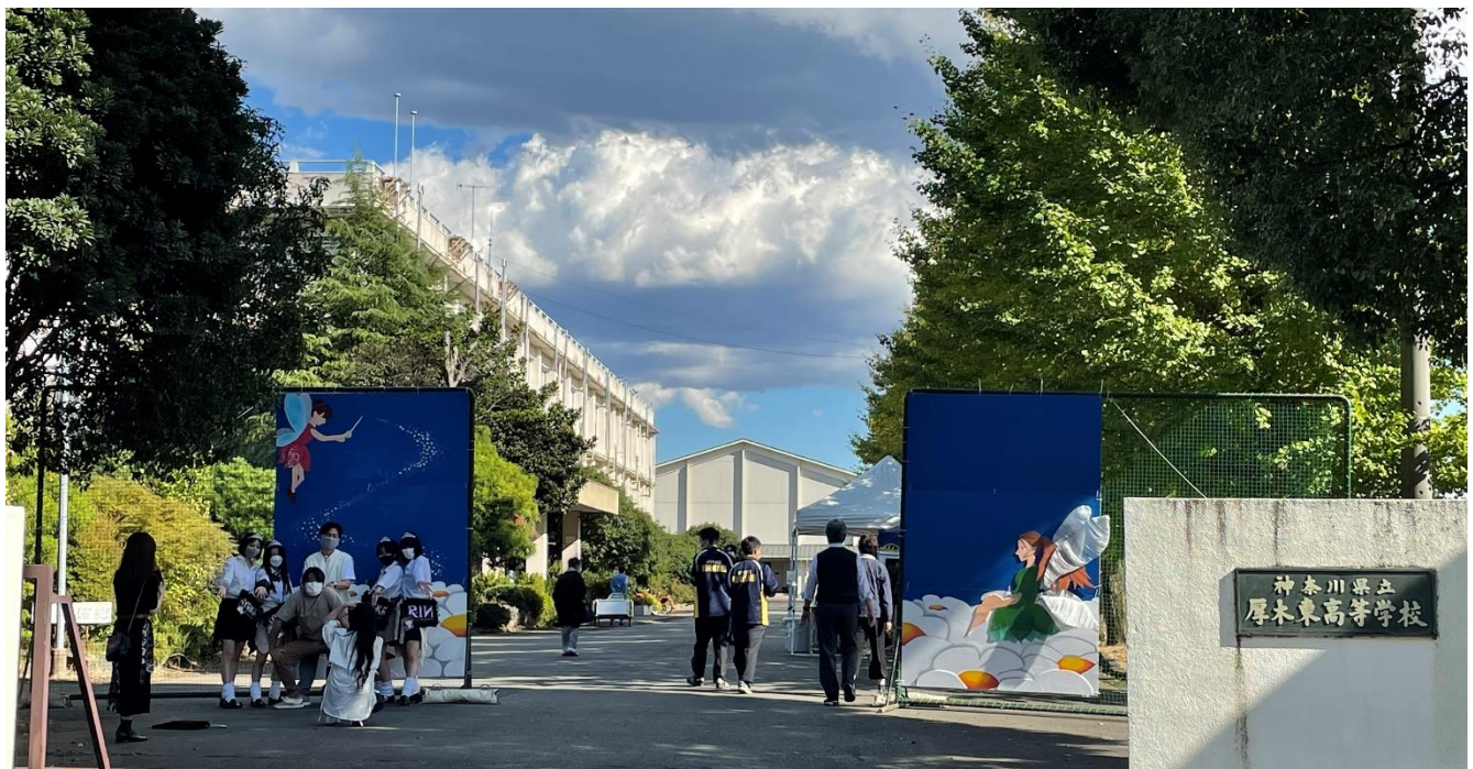
渾身の入場門前で記念撮影