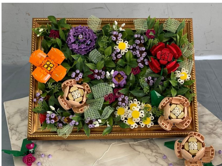
レゴブロックで生けたお花