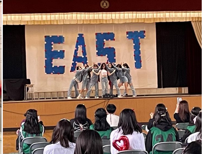
体育館での有志によるダンス