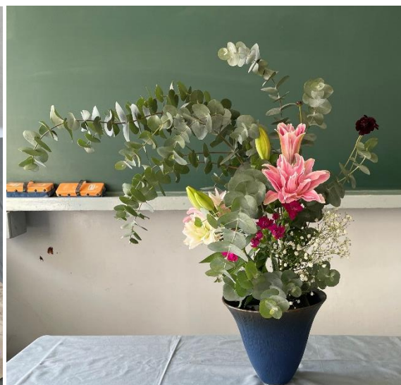
素敵すぎる活け花