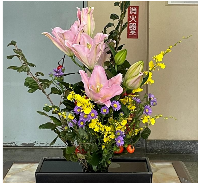
華道部さんの玄関のお花