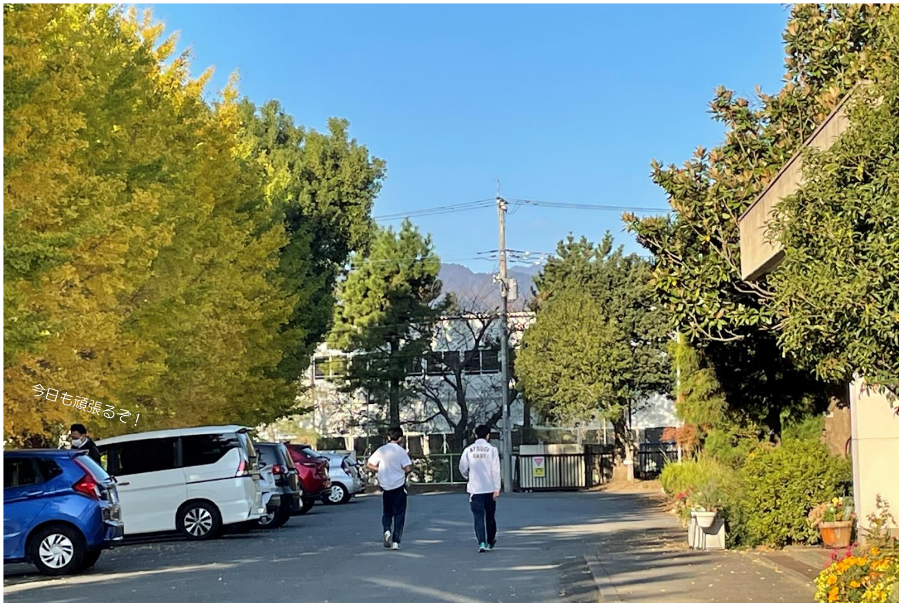
走るぞ！陸上競技部