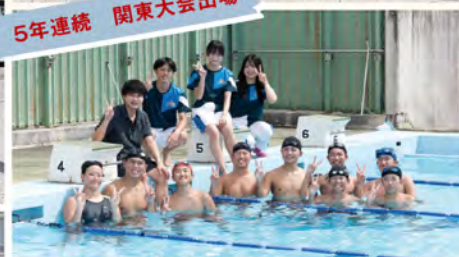
5年連続 関東大会出場