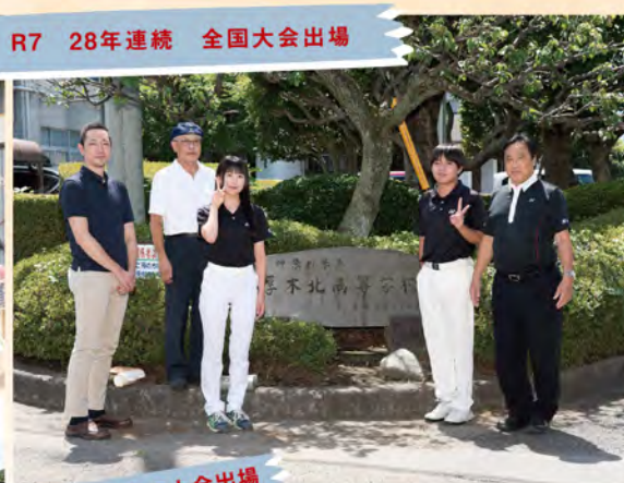
R7 28年連続 全国大会出場