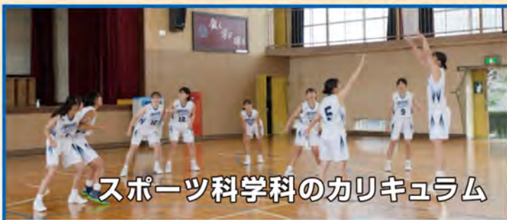
スポーツ科学科のカリキュラム