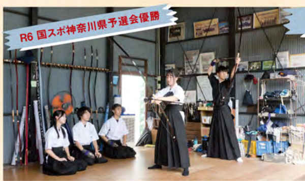
R6 国スポ神奈川県予選会優勝