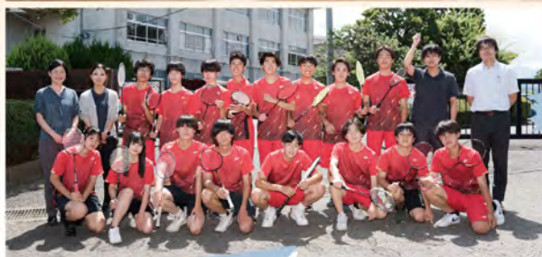
4年連続 関東大会出場 R6 ハイスクールジャパンカップ 全国大会 第5位