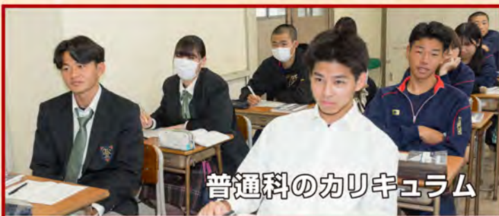
普通科のカリキュラム