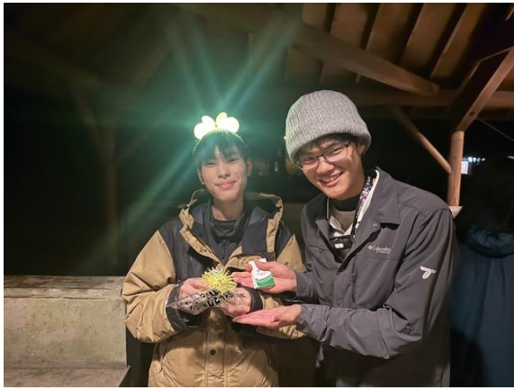
ミニーの電飾カチューシャと光るボール