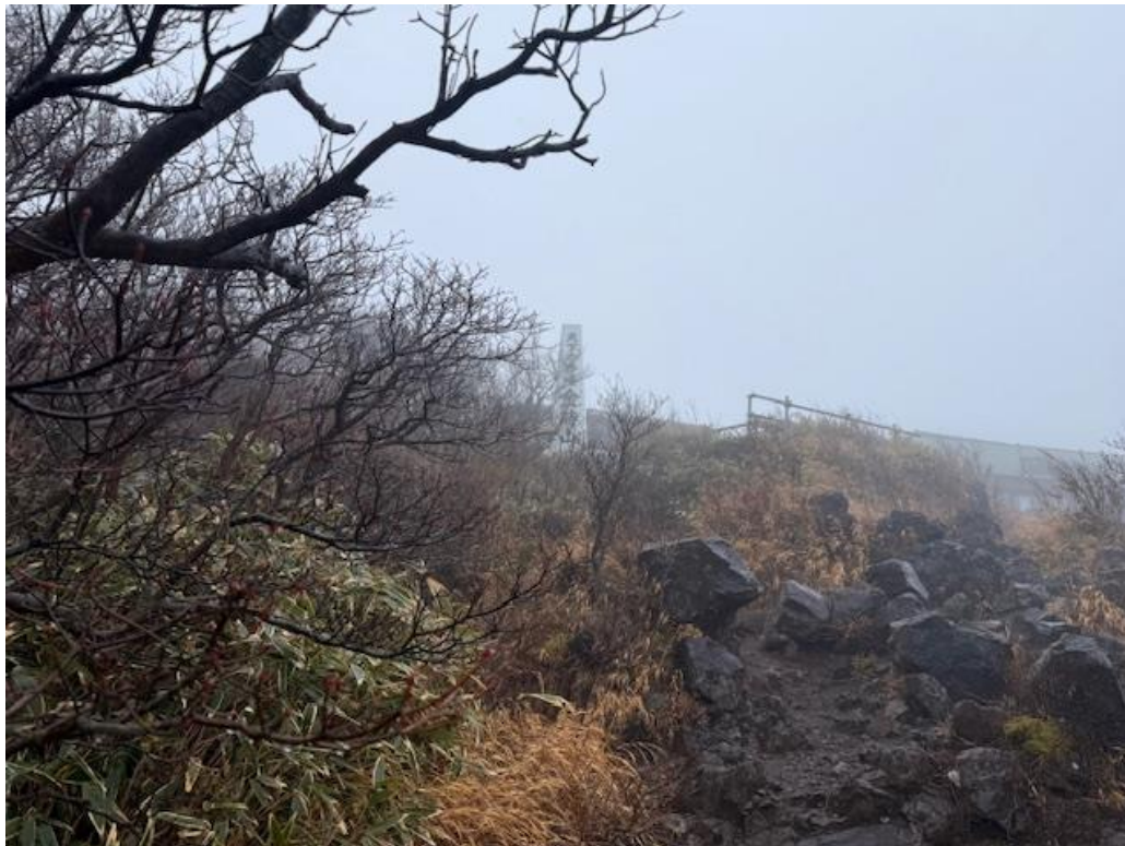
乙女峠から登ること1時間。見えてきました。