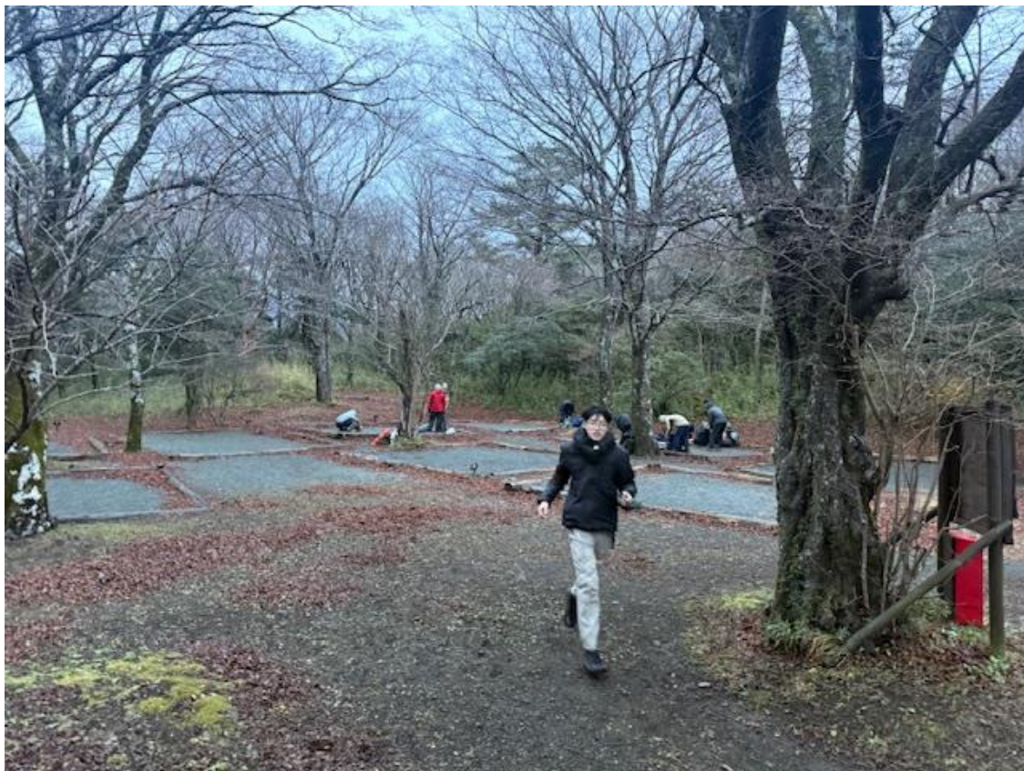
朝 5 時起床 朝食後、テント撤収。