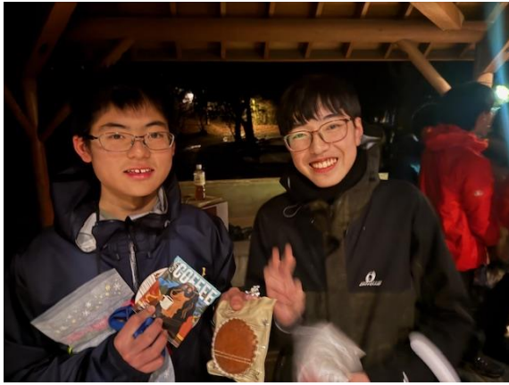
コーヒーとスイーツ