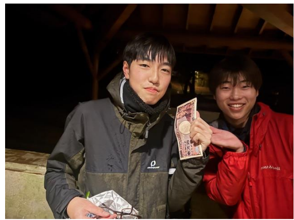
現金？のデザインがなされた財布