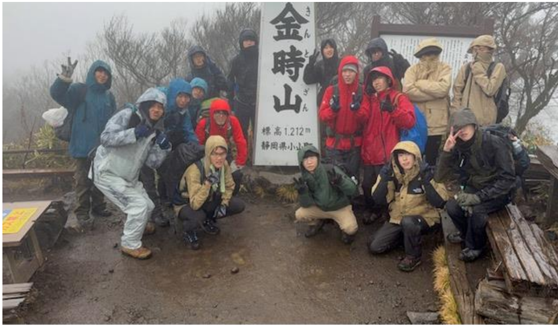
14：20 ごろ 降下前に記念撮影。