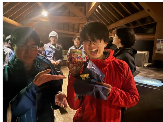
ほねほねザウルス（食玩？）