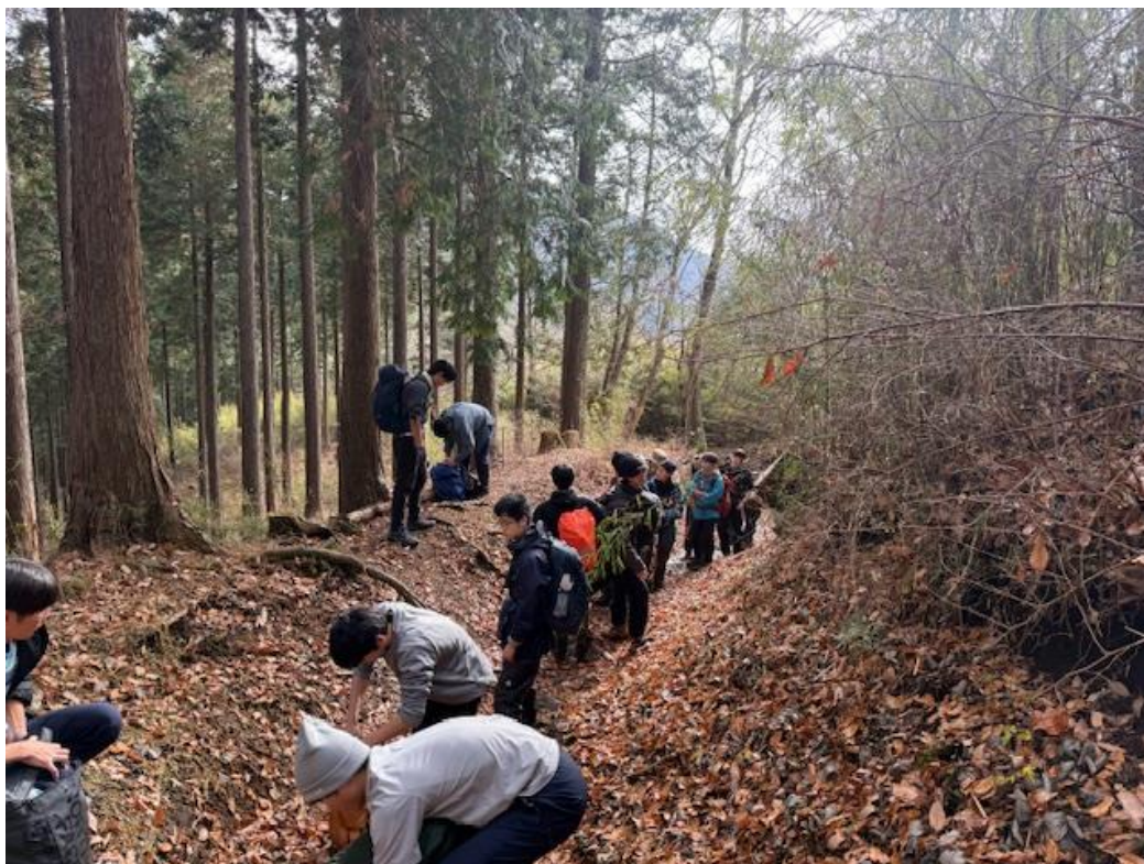
長尾峠を目指して登りましたが、暑くなったため脱衣を始めました。約 30 分後、長尾峠到着。