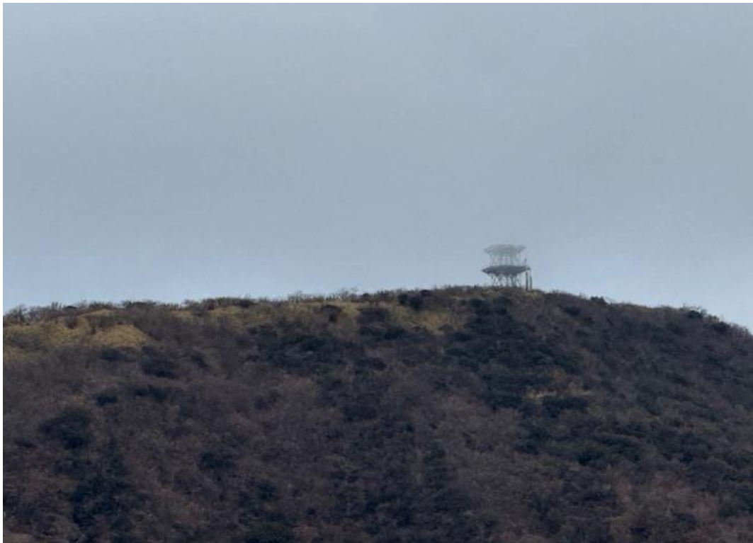
まずは長尾峠登山口をめざしました。途中で丸岳にある電波塔を目視。