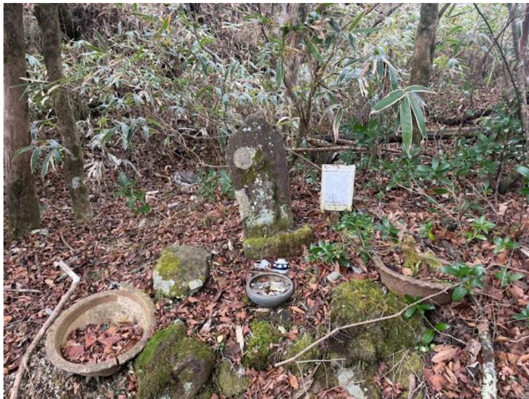
看板近くの石碑。登山客を見守っているのでしょう。