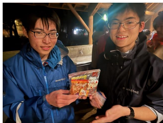
お菓子詰め合わせ