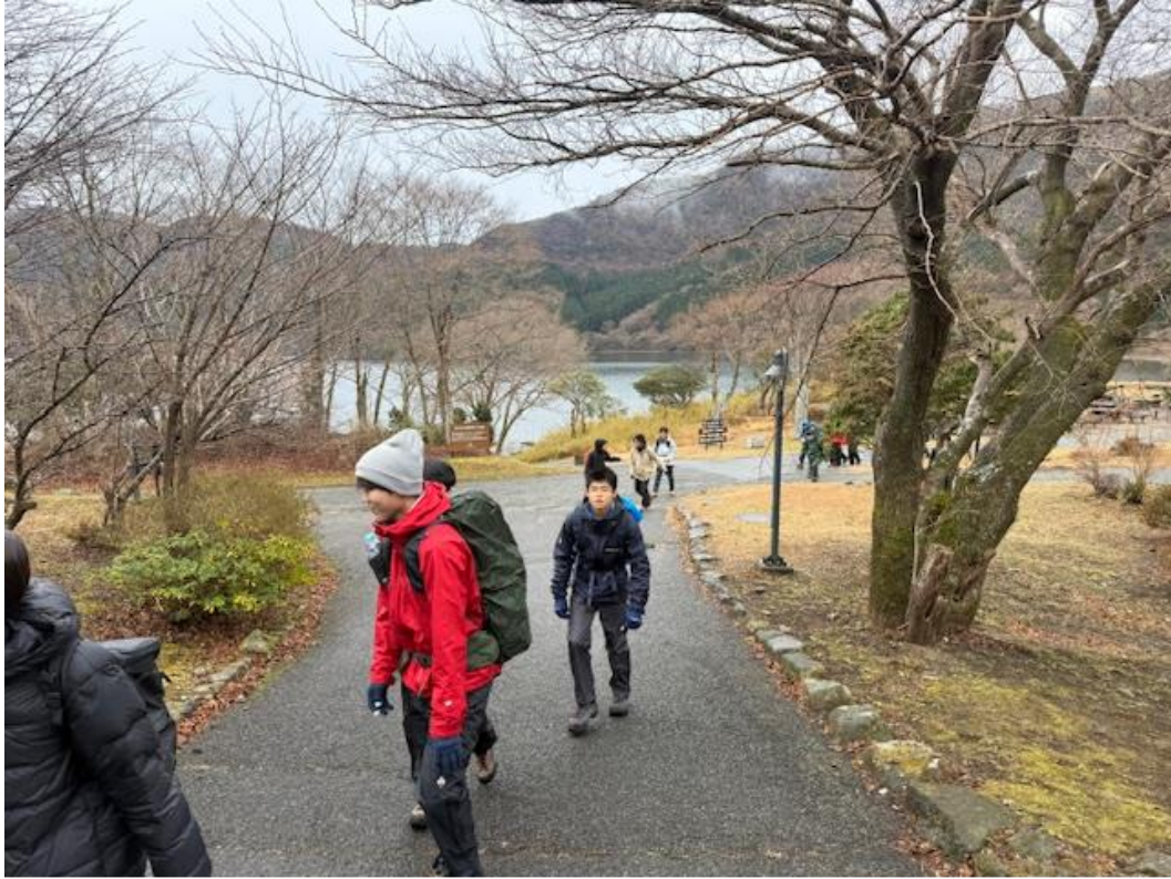
9:20 幕営地（芦ノ湖キャンプ村）でテント設営後出発。

この日は気温の上下が激しく、雨も降ったりやんだりを繰り返す状況でした。冬季の登山は衣類の脱着をしながら体温調節を行わなければならないところが難しく、装備品もかさばるので準備も夏山以上に工夫が必要です。