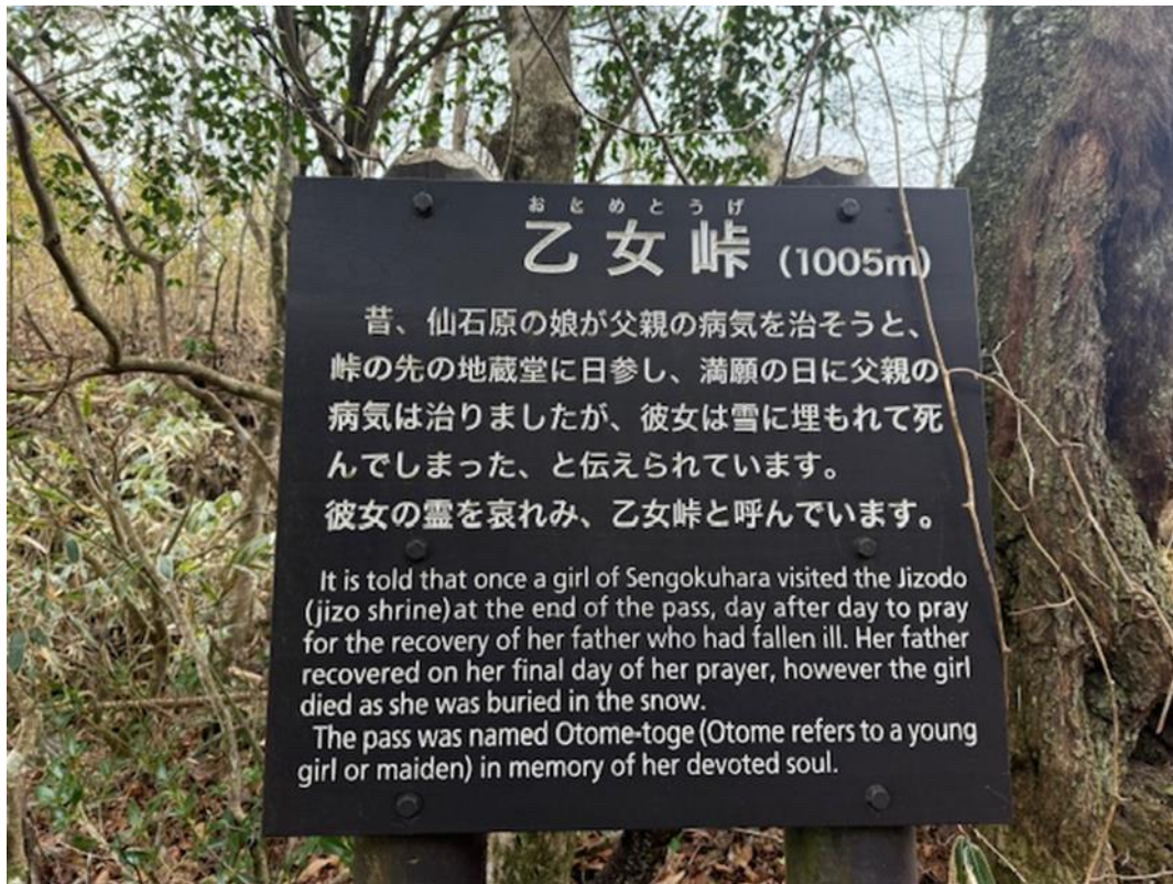
丸岳通過後、乙女峠に到着。