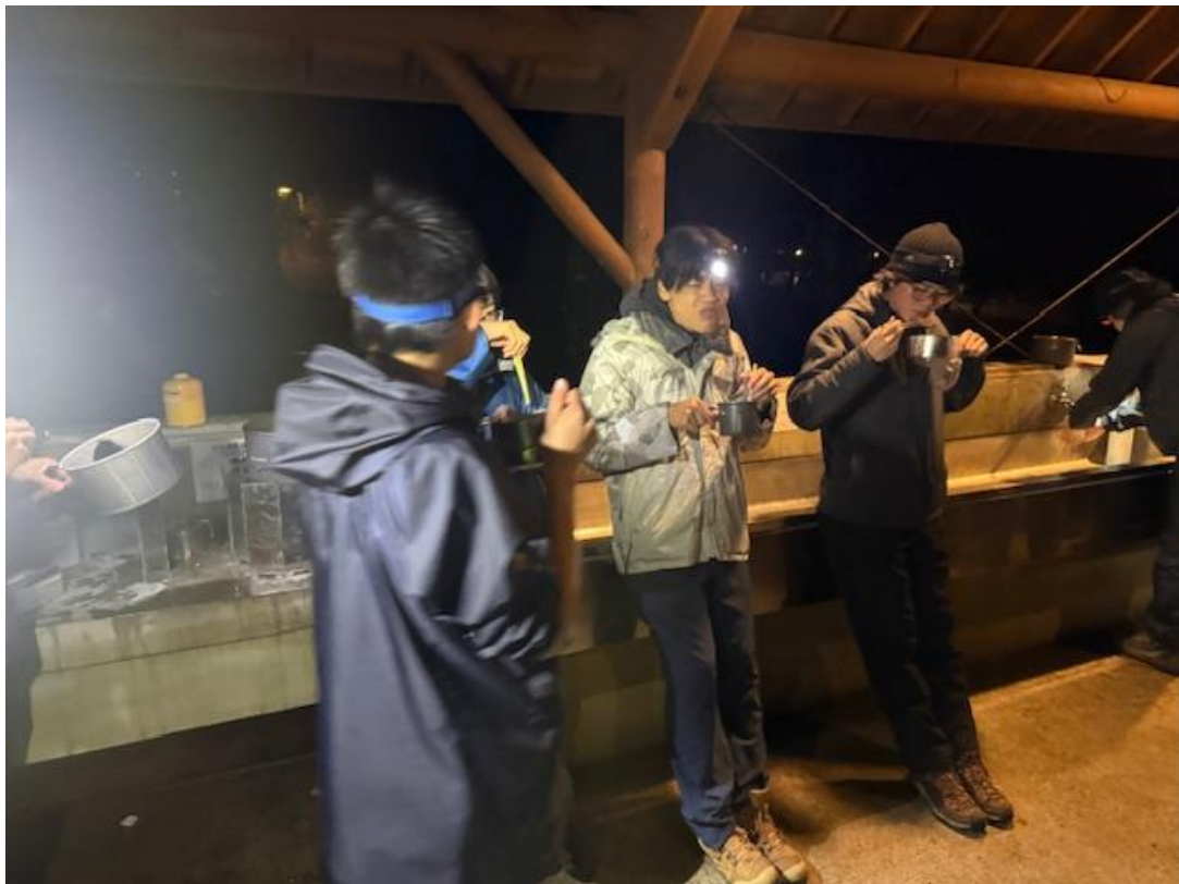
今後の課題は、少しでも重量を減らすための工夫（豆腐の水や液体のスープなどの扱いや、粉末の調味料などを使ってどのように再現するか）が必要です。