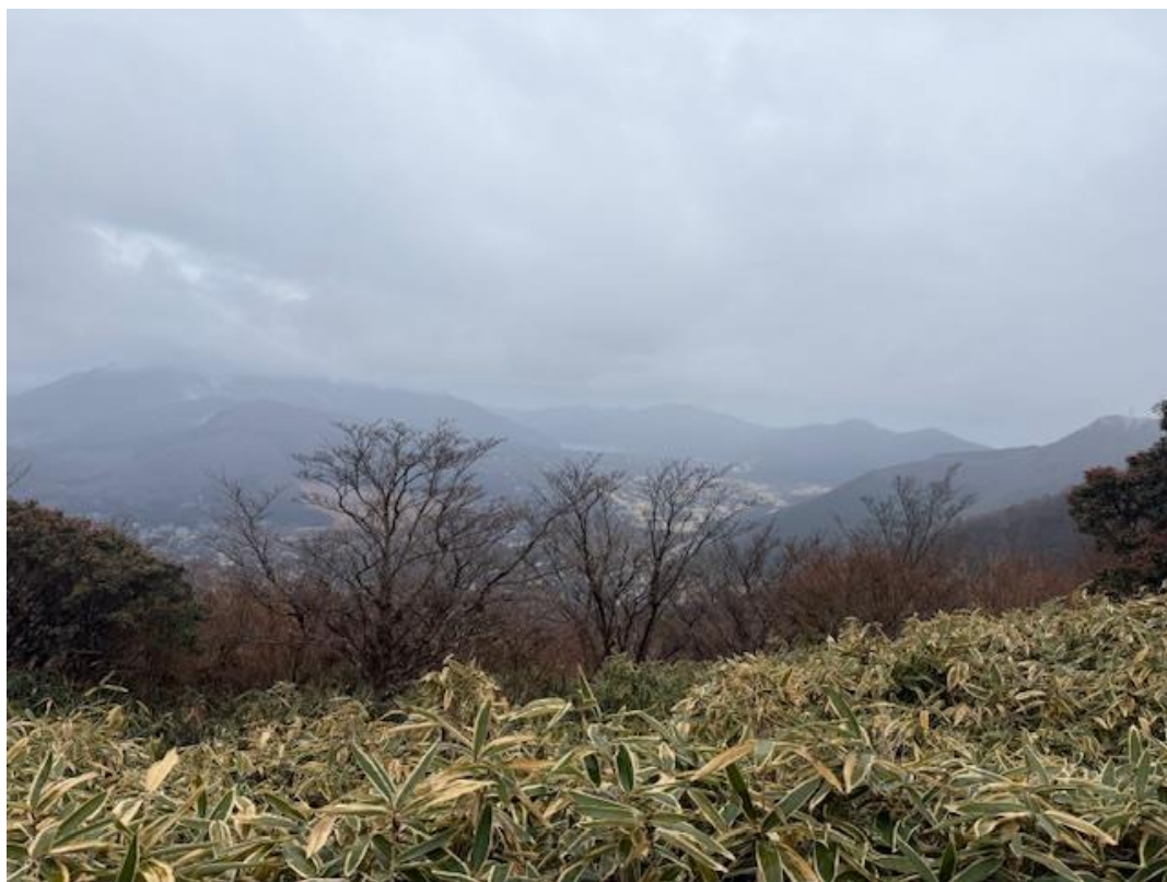
登山道から見た大涌谷方面。

今年の箱根は天気恵まれませんでした。6月は雷の危険があったためここで撤退しましたが、今回はこの先の長尾山と金時山山頂をめざして歩を進めました。