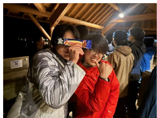
大きなチョコレートバー