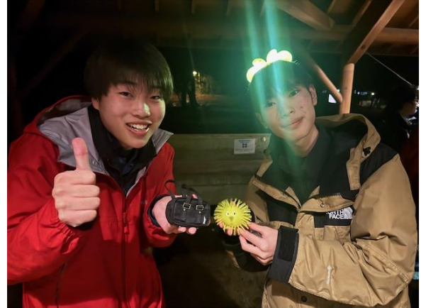
イヤホンホルダー