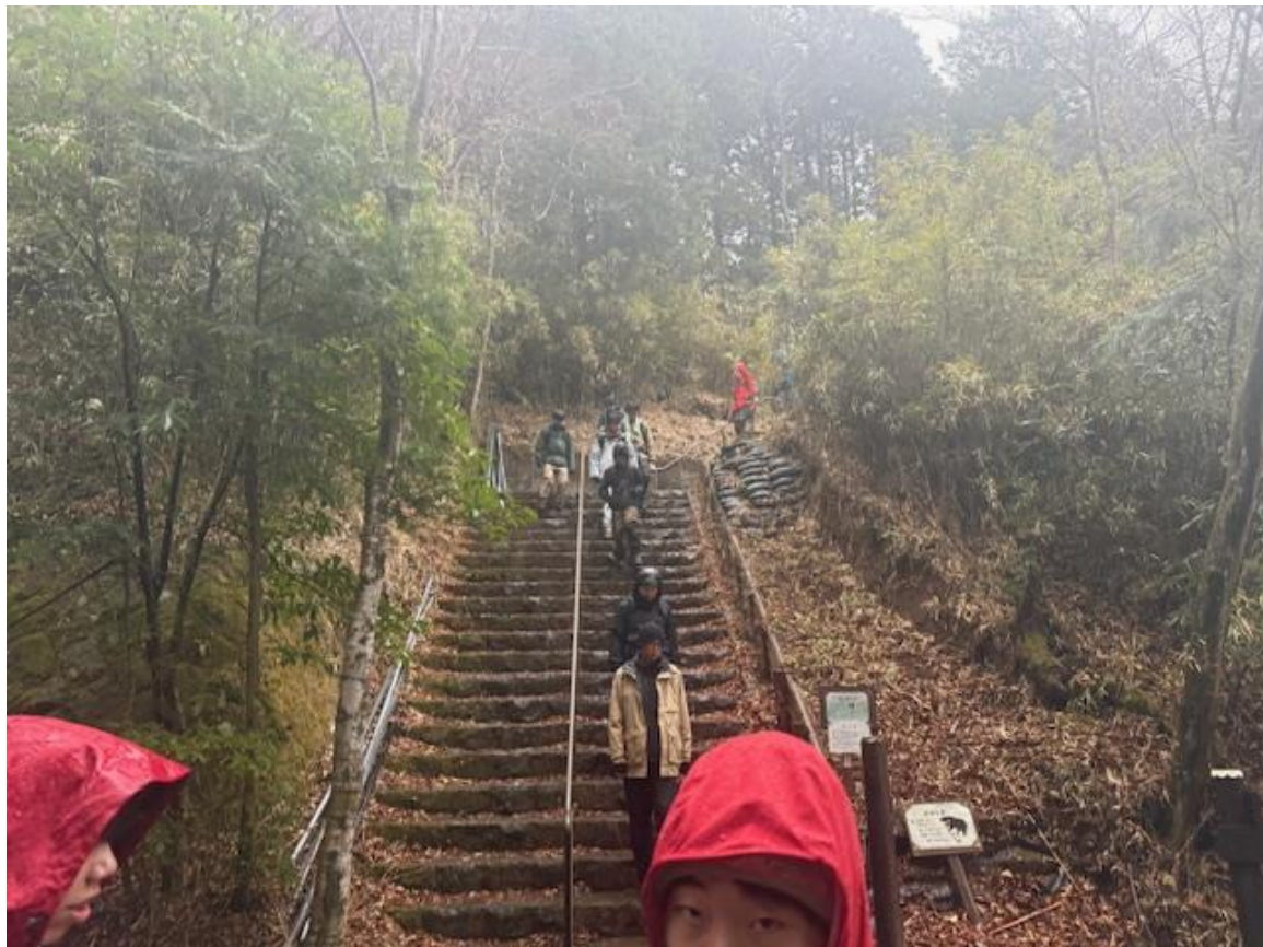
15：30 ごろ 無事下山。このあと幕営地に戻り、炊事訓練がスタートします。