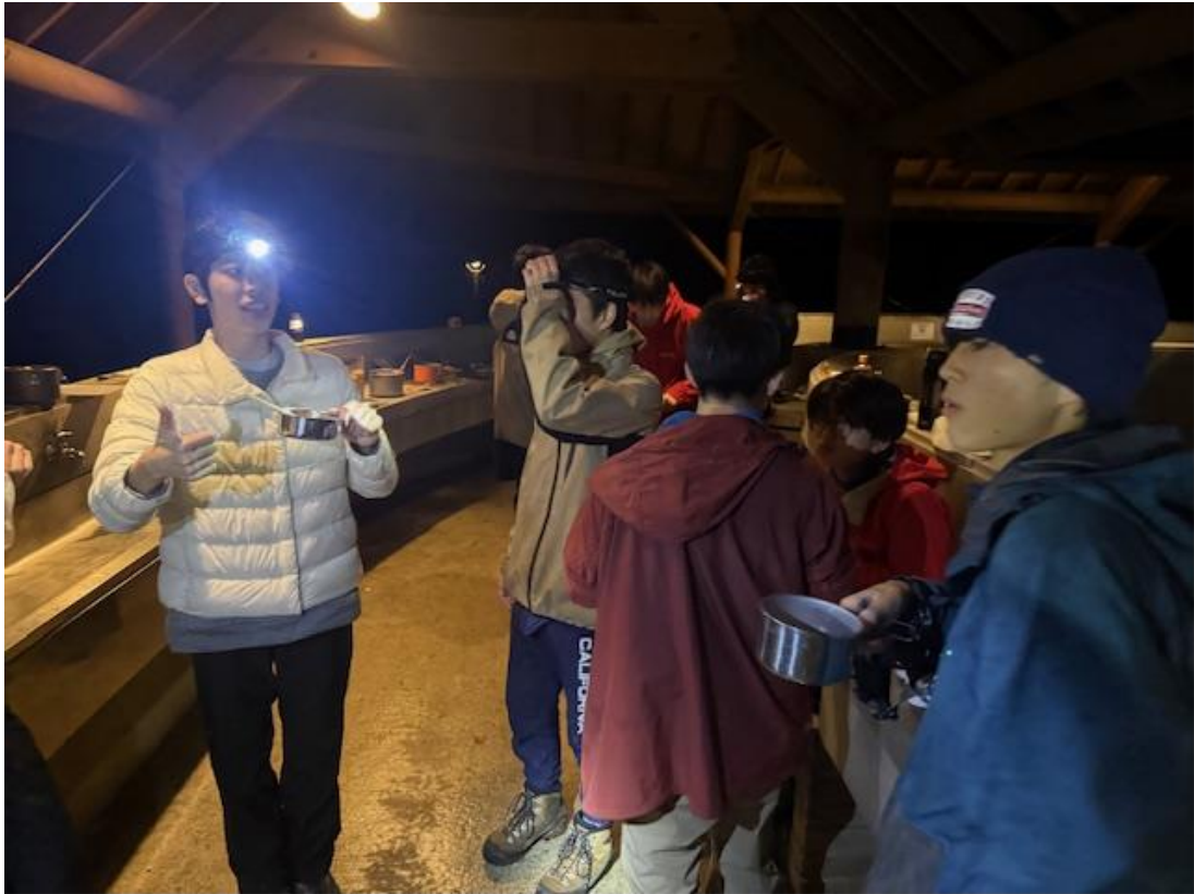
部員はそれぞれの班に分かれて作ったメニューをシェアしあっていました。