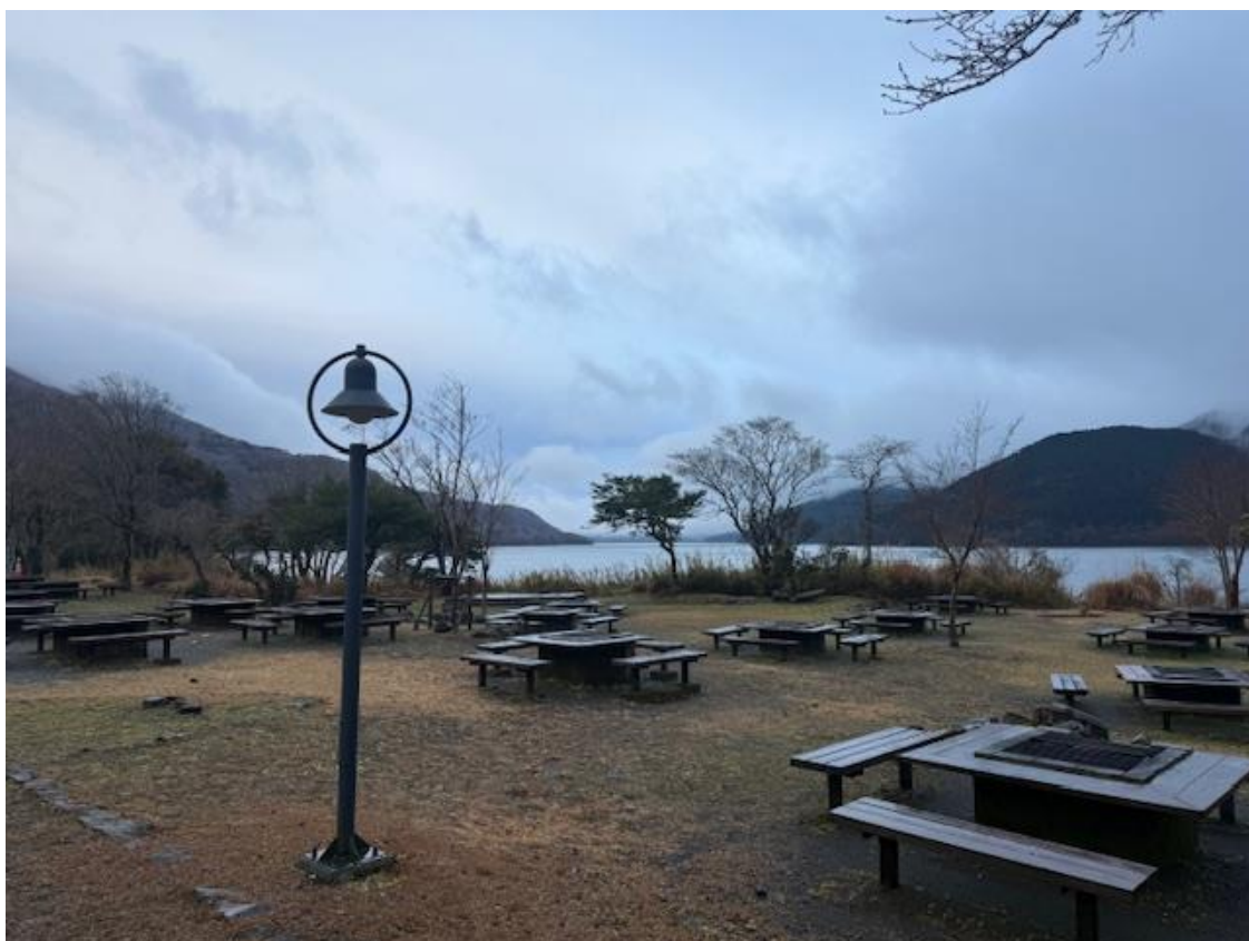
天気が良ければ駒ヶ岳と規制が緩和された神山方面に行き、火山を見学する予定でした…。