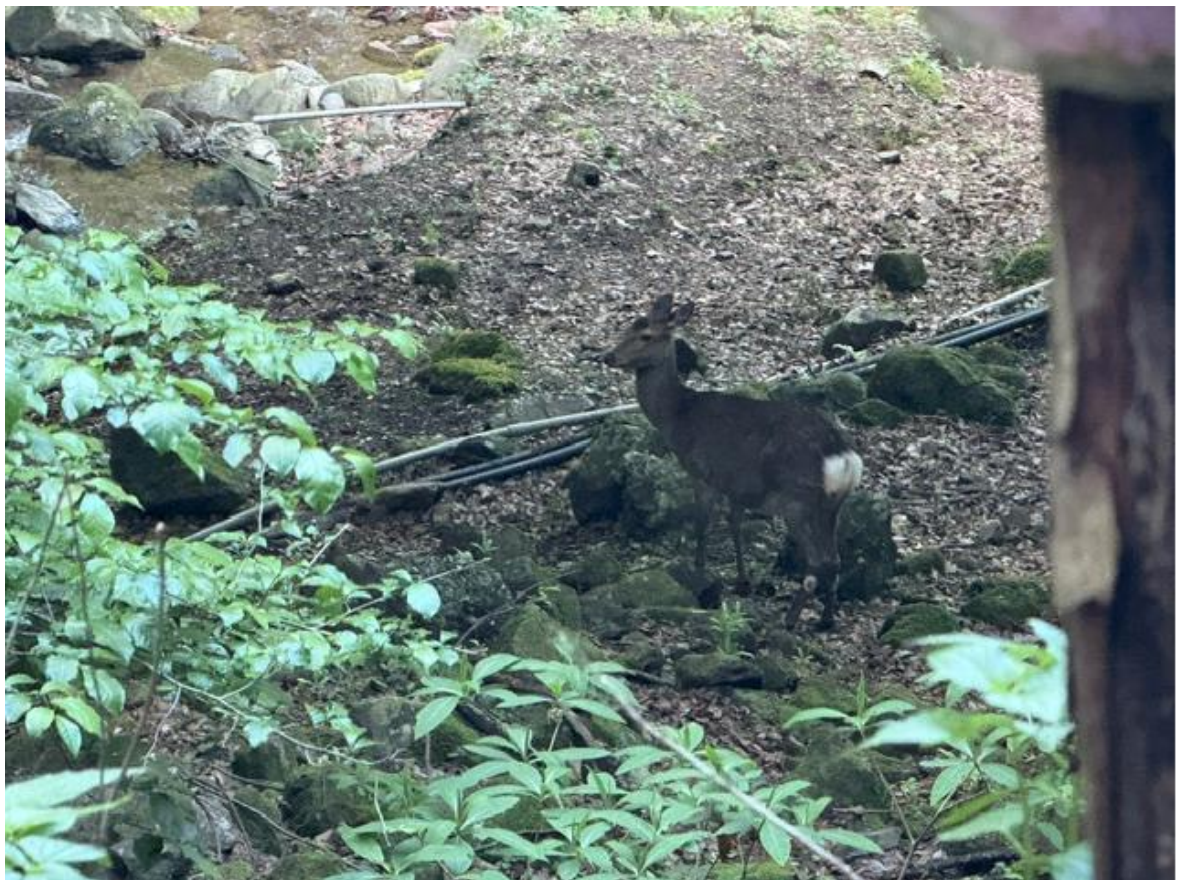
道中シカの見送りがありました。そして…