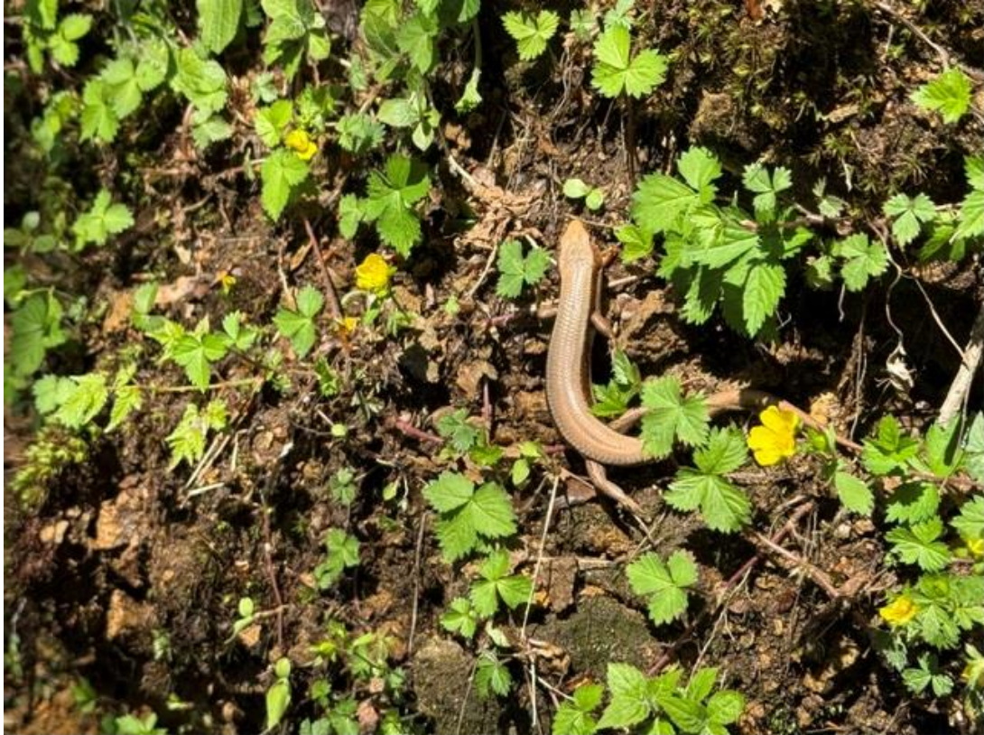
25 丁目を過ぎたあたりで出会ったカナヘビ (?)