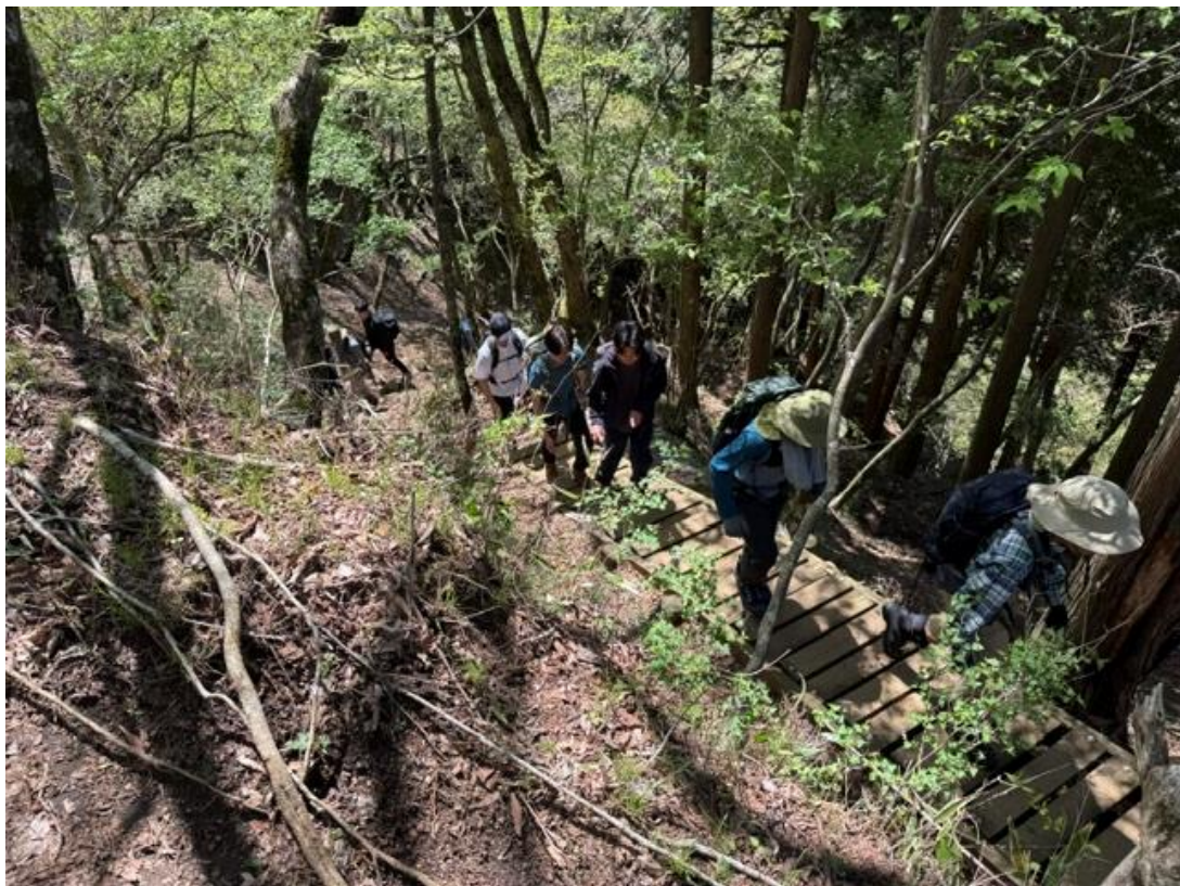
1年生と上級生が隊列の中で声を掛け合って行動しました。それが安全登山の第一歩です。