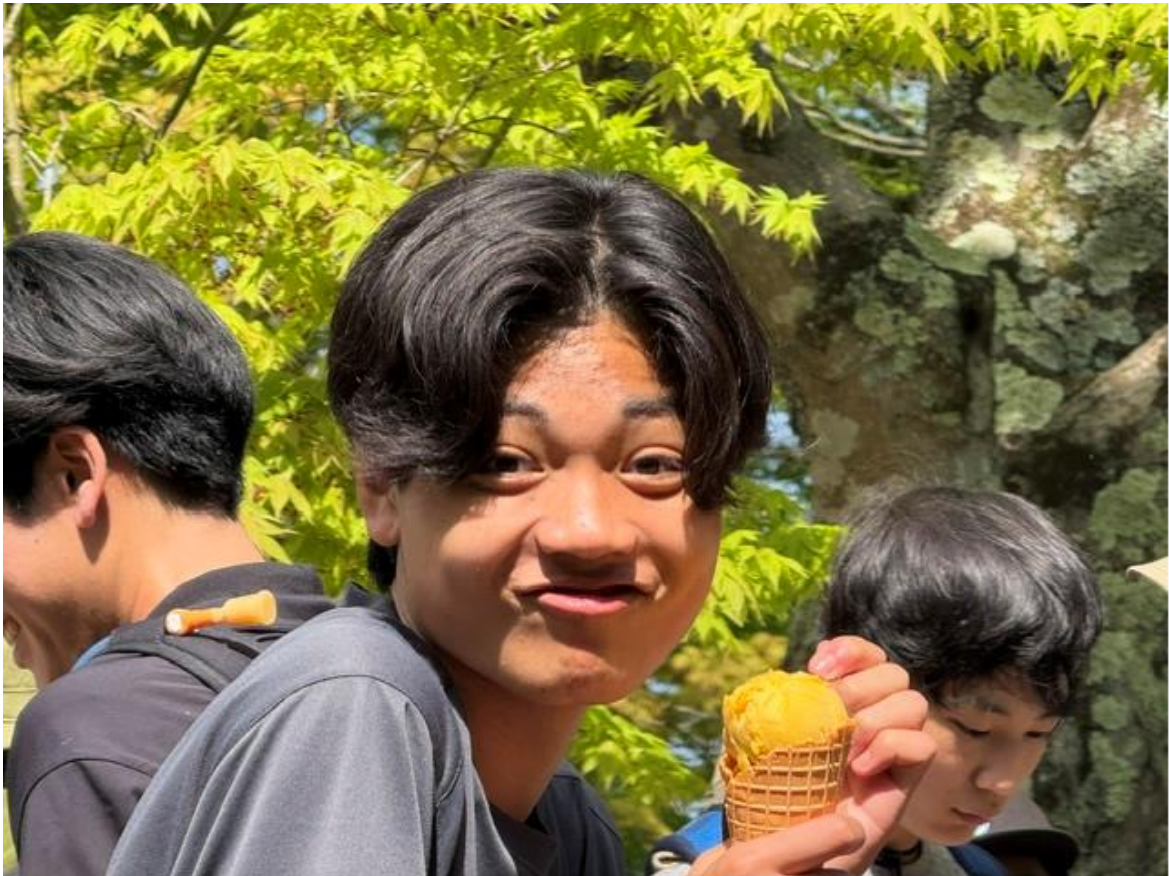
いつのまにかアイスクリーム大会に…