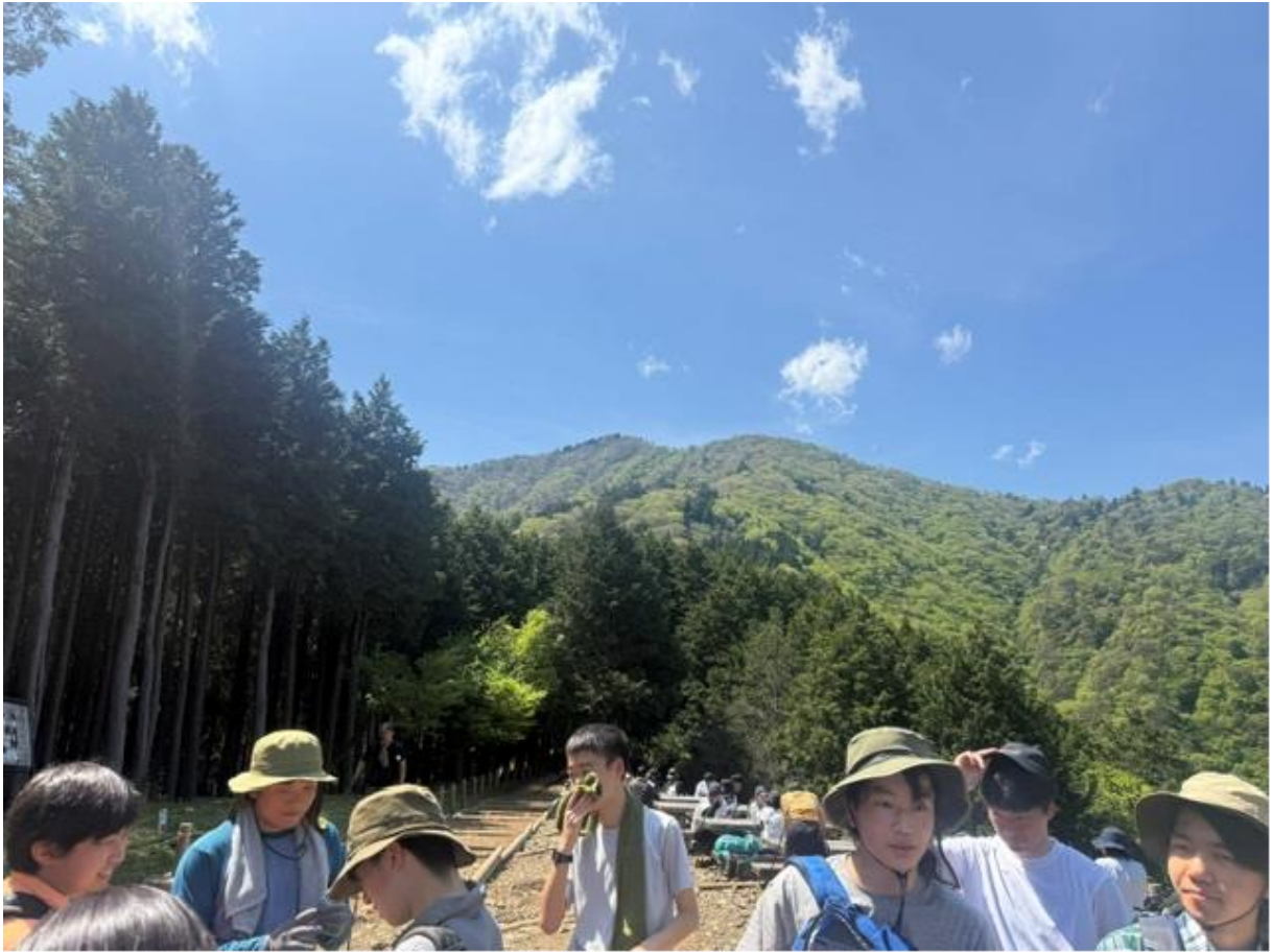
見晴台から見た大山山頂。「さっきまであそこにいたんだ〜。」