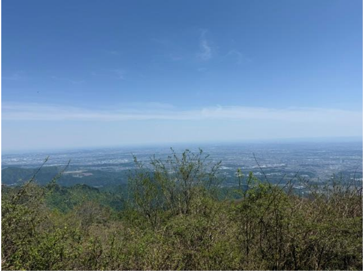
大山山頂から見た伊勢原方面。