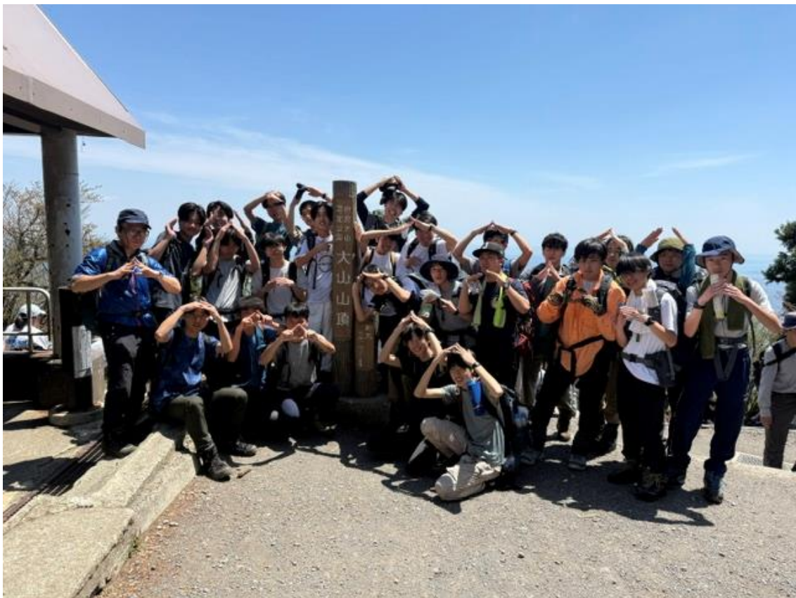
11:00 大山山頂に到着。天気も良くまさに「映え」です。