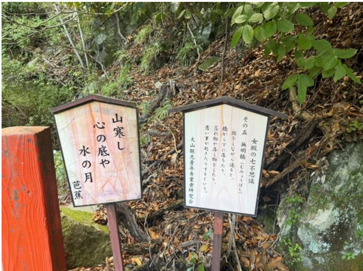
14:10 分ごろ大山阿夫利神社出発。女坂を經由して…