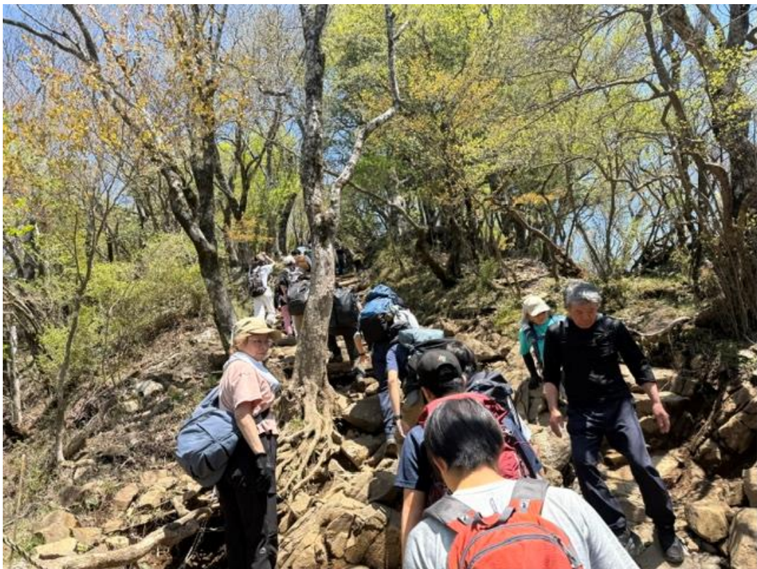
北陵は人数が多いため、道を譲ってくれました。ありがとうございます。