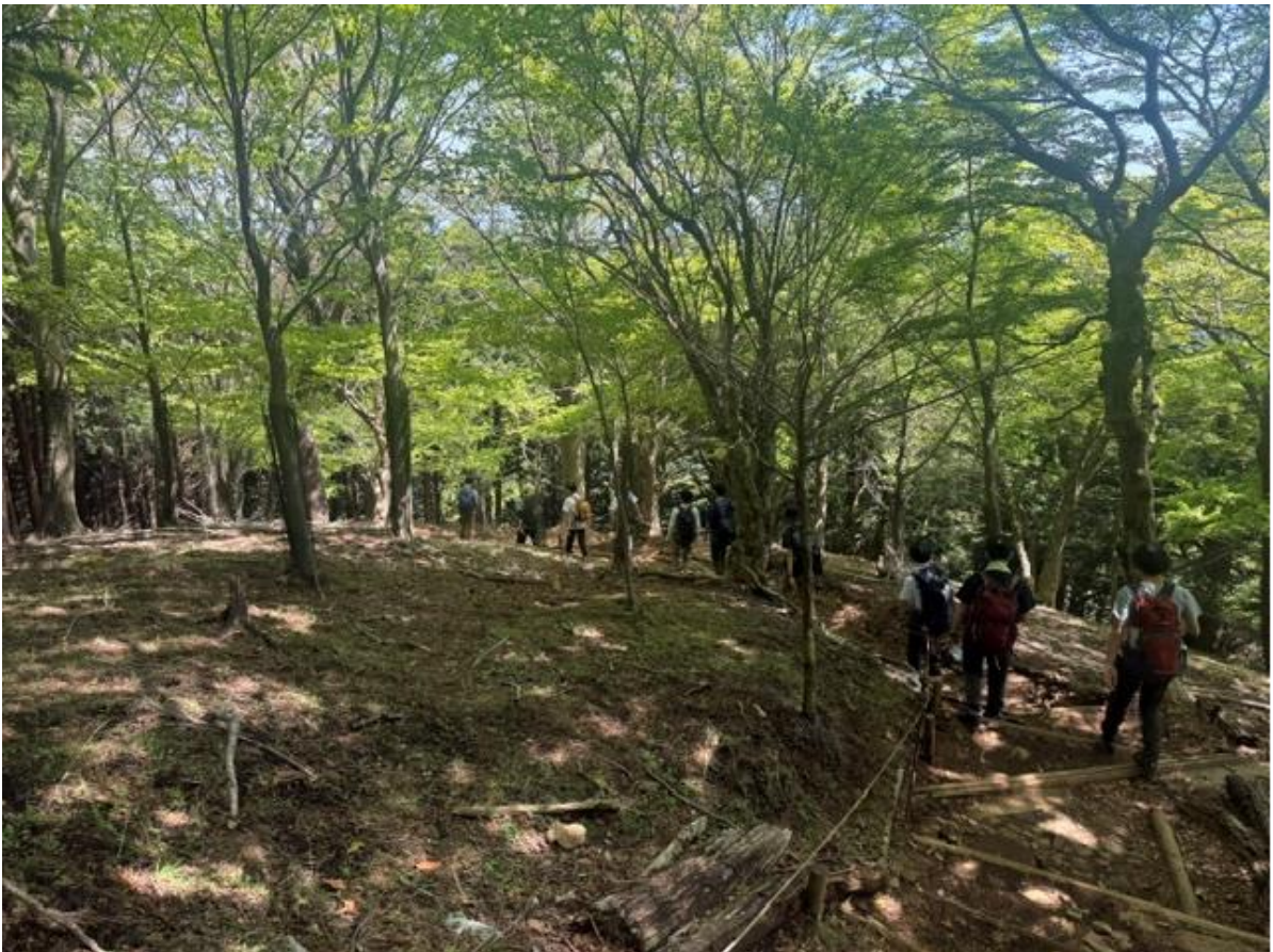
途中危険箇所がありましたが、隊員全員で声を掛け合い無事通過しました。