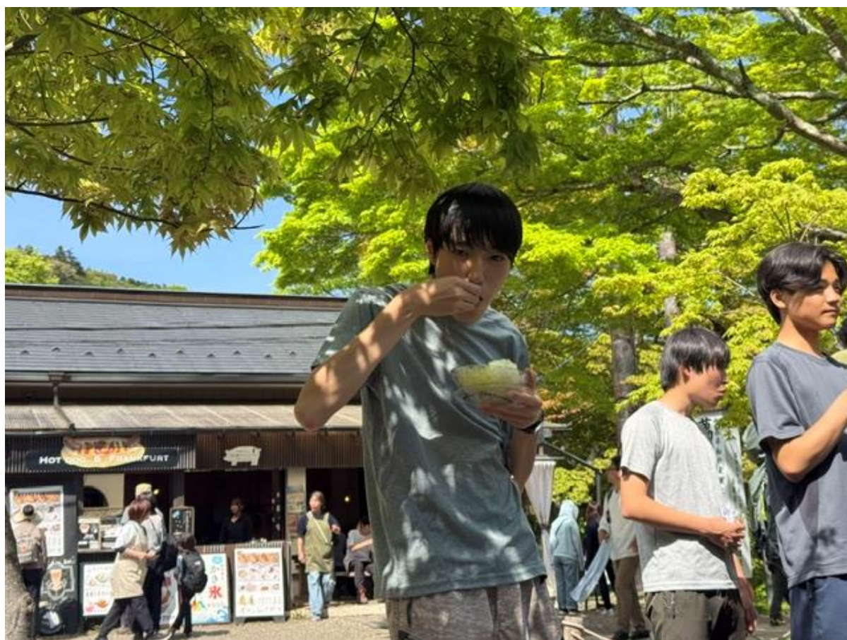
13:50 ごろ大山阿夫利神社到着。トイレ休憩「だけ」のはずが…