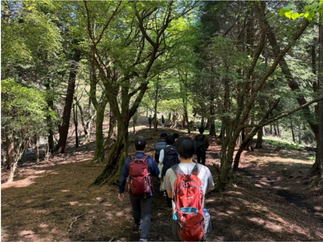
このコースは大山山頂まではなだらかな傾斜を登っていきます。初心者にはうってつけです。