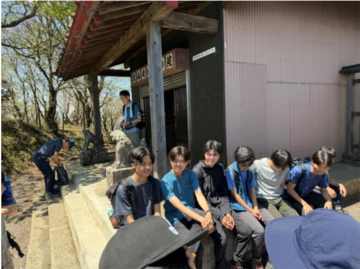
ここで毎年恒例の3年生からのありがたいお言葉をいただきました。「これからがんばれよ！」とのこと。