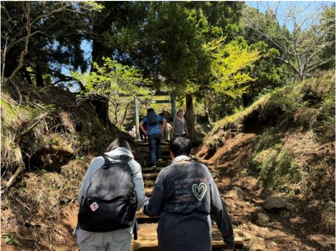
鳥居が見えてきました。山頂まであと少し。