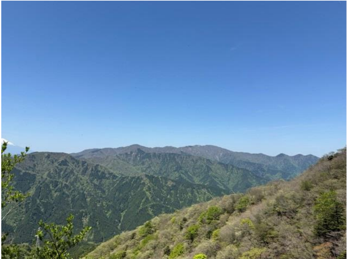
道すぐらに見える三ノ塔方面。雲一つない絶好の天気です。