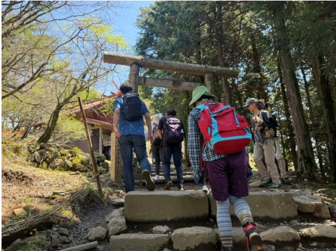
2つ目の鳥居を通過し…