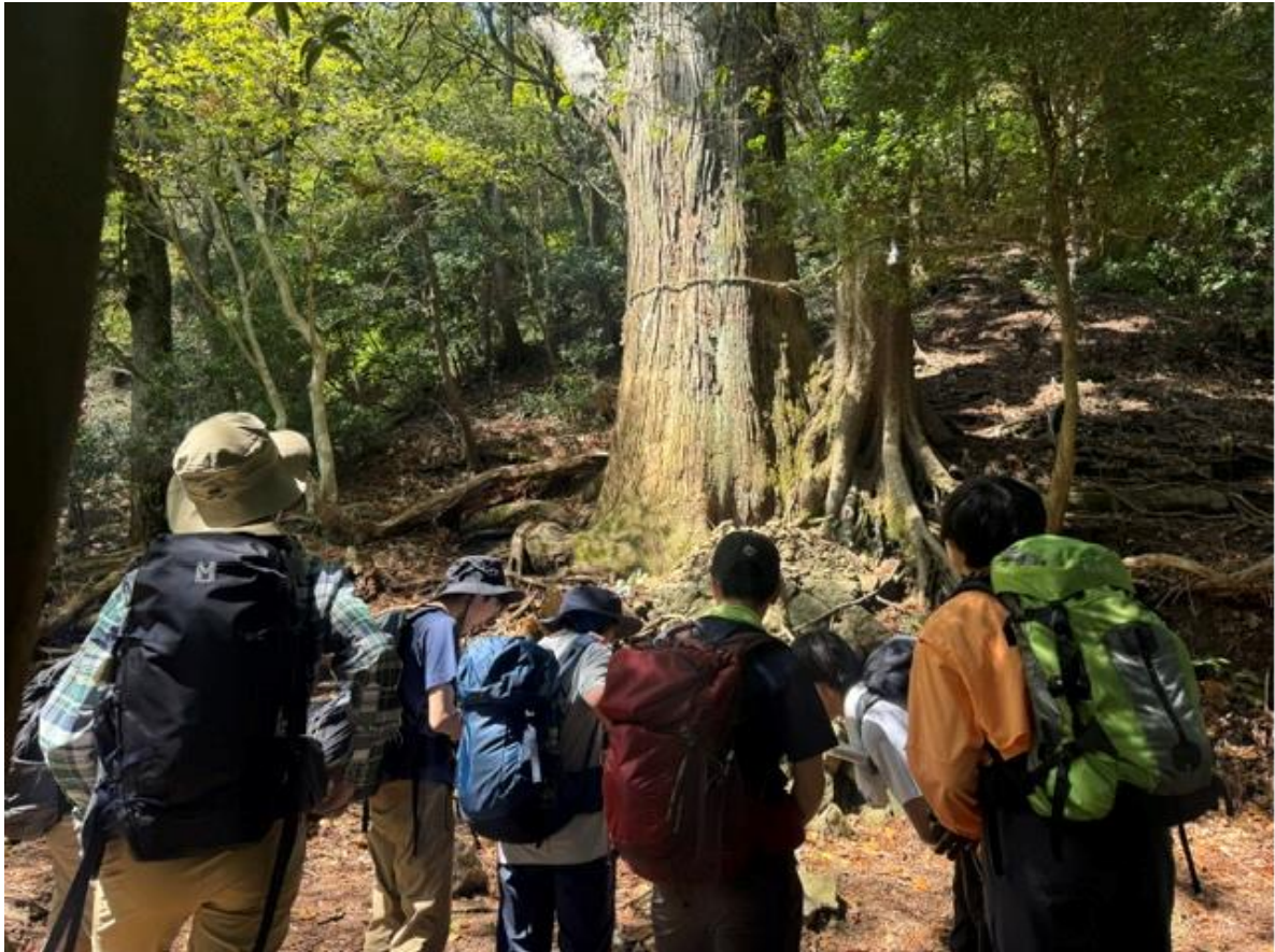
コース途中のご神木。