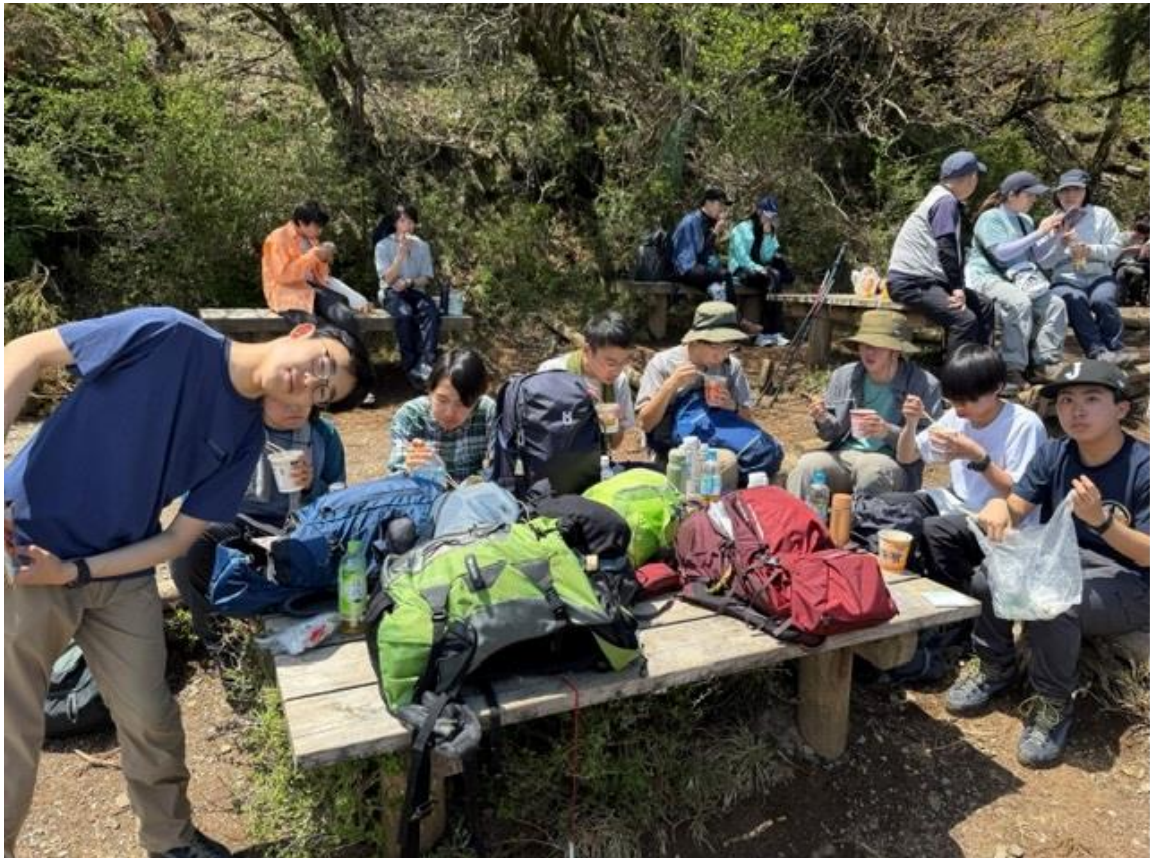
カップラーメンを黙々とすする…