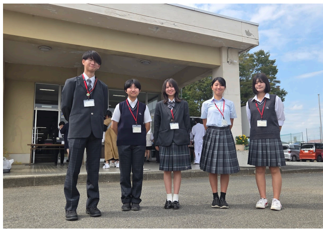
新制服を着用した生徒たち

次回の体験入学は12月13日（土）です。参加ご希望の方は、HPにて11月下旬より受付を行います。（中学3年生限定）また、11月1日（土）2日（日）に開催される秋輝祭（文化祭）でも中学生相談コーナーを用意しておりますので、ぜひお越しください。