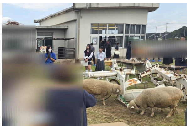
動物のふれあい体験の様子