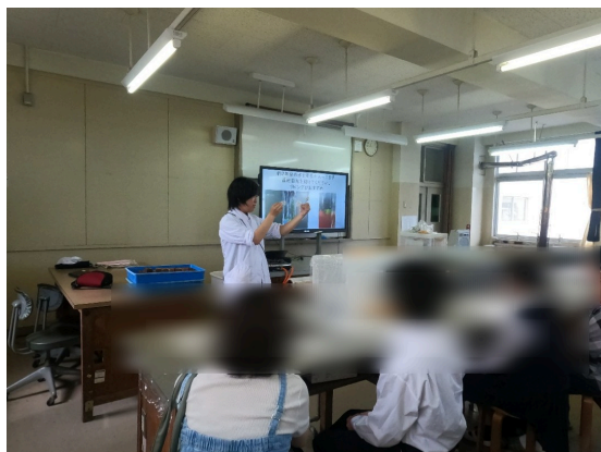
植物バイオ 説明の様子