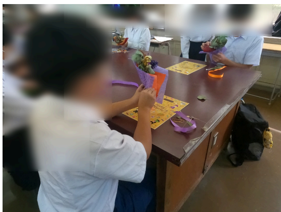
スワッグ作りの様子