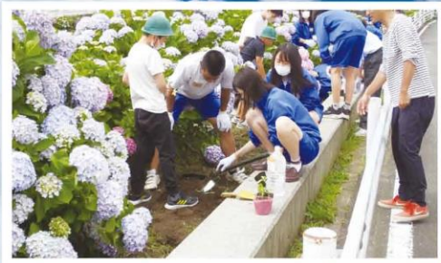
3校交流ひまわりの苗植え