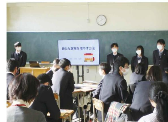
リーダーシップ開発の授業の一コマ