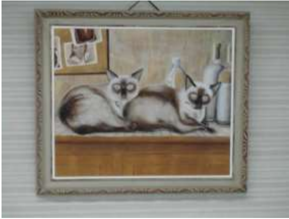
作品 9 姉弟