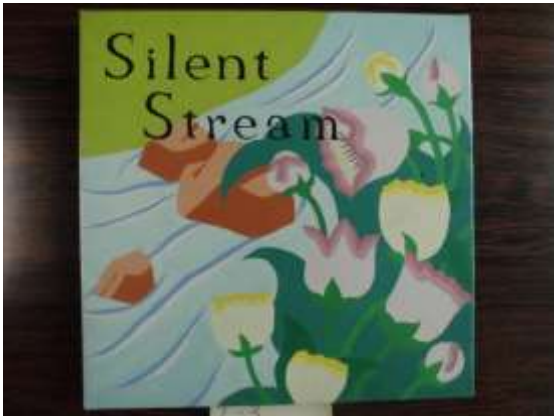
作品 10 Silent Stream