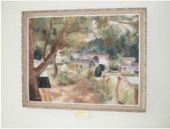
作品 6 油絵（写生風景）