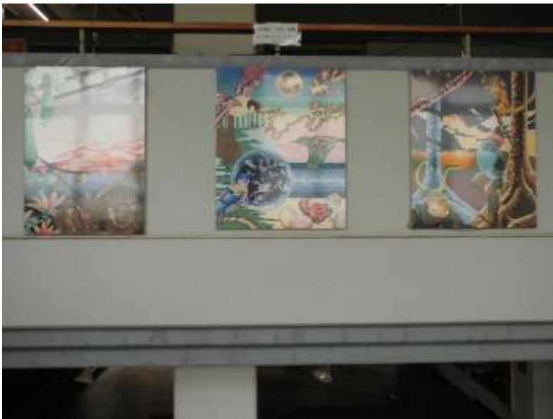
作品2 秋の連続 作品3 自由 作品4 向こう側 (へちま・栗) (鳥4羽) (鳥、カエル他)