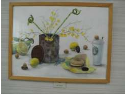
作品 13 静物画