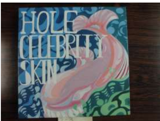
作品 12 HOLE CELEBRITY SKIN