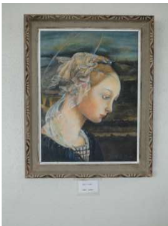
作品 8 聖母マリアの模写