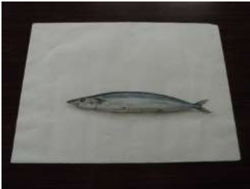
作品 14 さんま