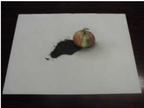
作品 15 たまねぎ