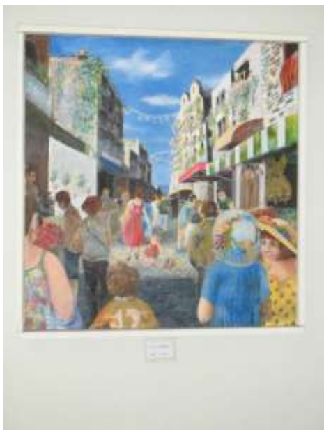
作品5 ジャズ・ラッパの連続風景