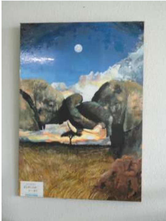
作品 7 SAHARI