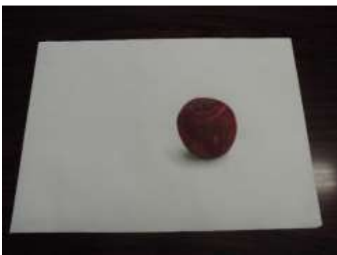
作品 16 りんご