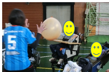
〈小田急ソフトバレーボール教室〉 ※コロナ前の様子です