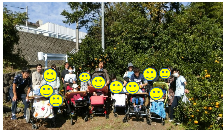
〈令和元年度11月のみかん狩りの様子〉

日頃、学校への登校が難しい児童生徒も病棟内の授業なので、看護師同行で参加が可能になることが多く、集団活動を経験する貴重な機会となります。