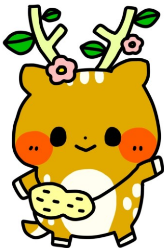
秦野養護学校 イメージキャラクター いぶきちゃん