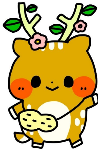
秦野養護学校 イメージキャラクター いぶぎちゃん