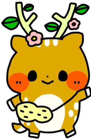
秦野支援学校 イメージキャラクター いぶきちゃん