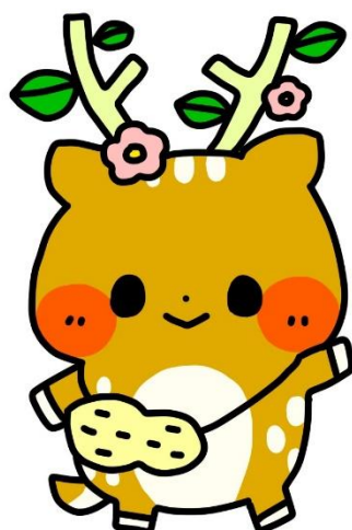
秦野支援学校 イメージキャラクター いぶきちゃん