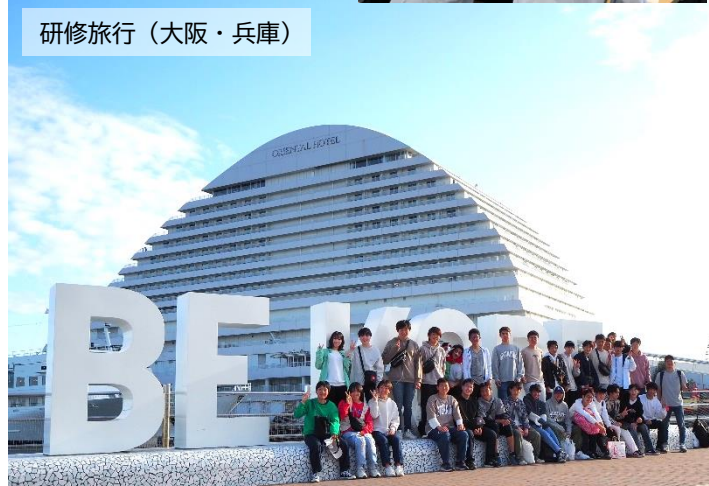
研修旅行（大阪・兵庫）