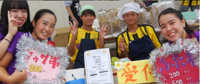
清峰祭（スポーツクラスによるソーラン節披露）