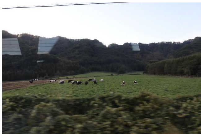
バス移動中に牛が！↑↑