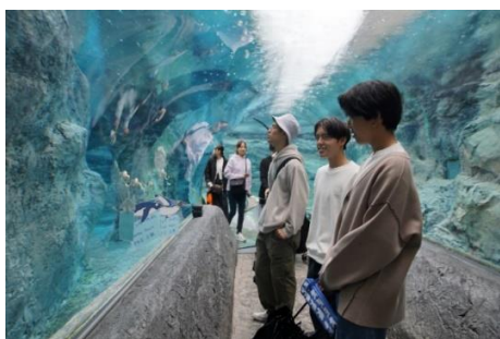
旭山動物園のペンギンの水槽↑↑