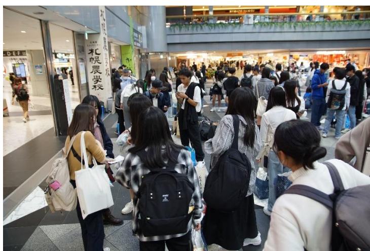
いざ、神奈川へ帰ります！^^