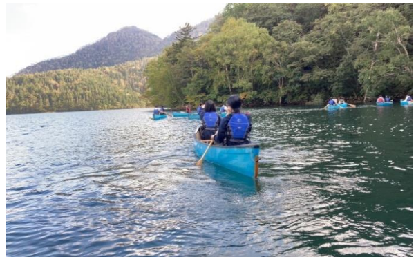
カナディアンカヌー↑↑