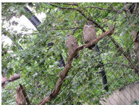
北海道のみに生息するシマフクロウ↑↑