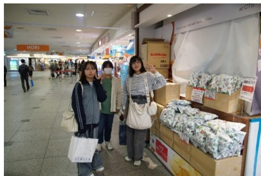
お土産もたくさん買いました^^