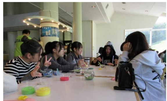
キャンドルづくり↑↑