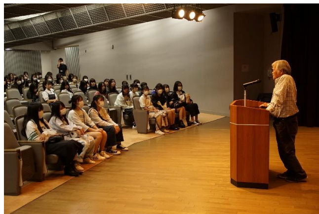
アイヌ民族の方の講演↑↑