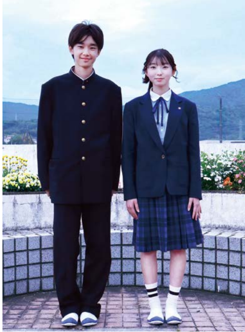
Winter Style 冬のスタイル