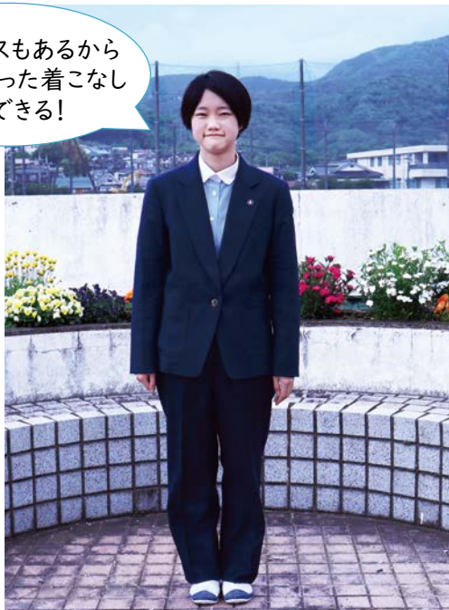
Slacks Type スラックスタイプ