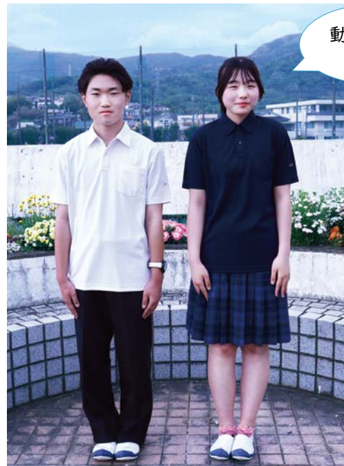
Summer Style 夏のスタイル~ポロシャツver~