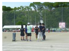
教員による安全打ち合わせ