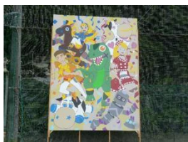
Cブロック：おもちゃ