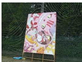
Aブロック：ワンダーランド