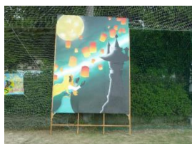
Bブロック：塔の上のプリンセス