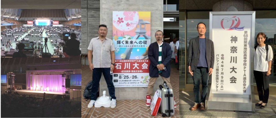
(全国高等学校PTA連合会大会、関東地区高等学校PTA連合会大会)

<主な活動> 毎年5月にPTA総会を開催しております。8月を除く毎月、運営委員会を開催し、PTA行事の審議、承認、調整、連絡を行っています。事前には本部会を開催し、資料・担当者の確認などを行っています。校外活動では、高等学校PTA連合会関係の大会や研修会にも参加しています。