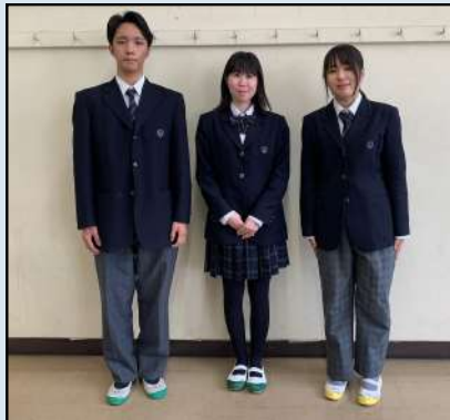
左：男子制服 中央：女子制服 (スカート) 右：女子制服 (スラックス)