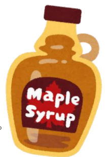
カエデと メープルシロップ