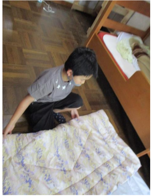
朝起きたら、自分で布団をたたんだよ。