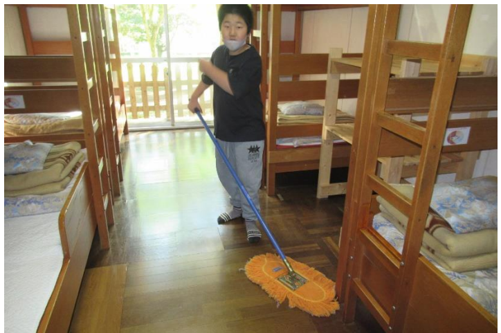
使った山荘のお掃除もがんばりました。