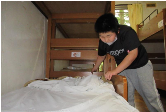
寝る前に布団の準備も自分でやりました。