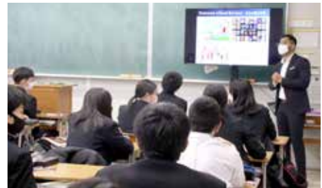
■ 英語による日産テクニカルセンターとの提携授業