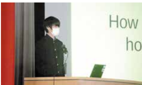
■ スピーチフェスティバル