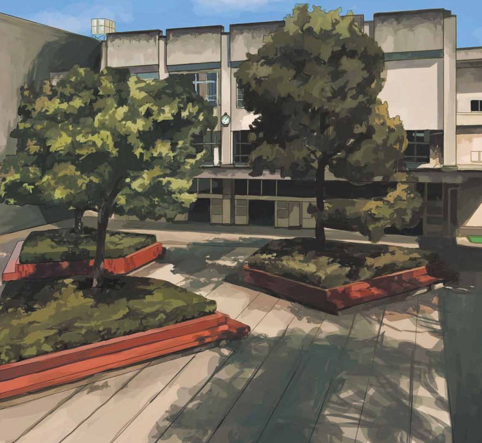
カバーイラスト/ 杉村 美羽 (2年生)