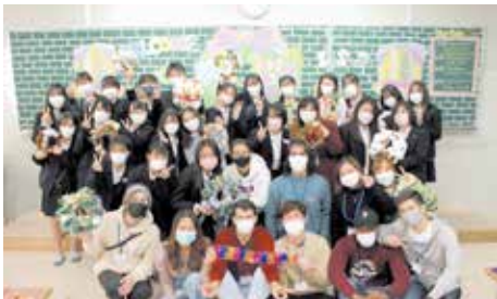
■ 東海大学留学生交流会

国際理解を深めるために、少人数での英語の授業を取り入れて、英語力アップを目指しています。 また、今後海外のフレンドシップ校への訪問も計画しています。