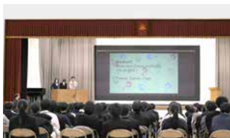
■ スピーチフェスティバル