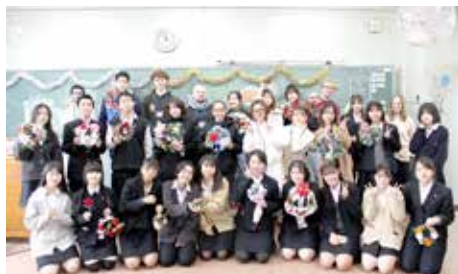
■ 東海大学留学生交流会

異文化への理解を深めるために、少人数での英語の授業を取り入れており、1, 2年生は全員実用英語技能検定を受験しています。また、今後海外のフレンドシップ校への訪問も計画しています。