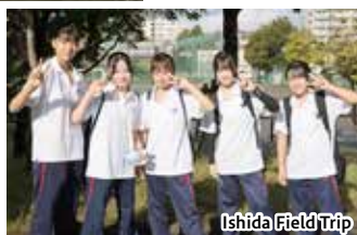
Ishida Field Trip