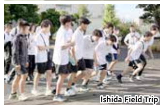
Ishida Field Trip