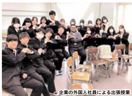
企業の外国人社員による出張授業