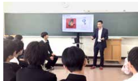
■ 日産テクニカルセンターとの提携授業