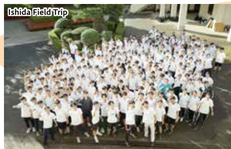
Ishida Field Trip