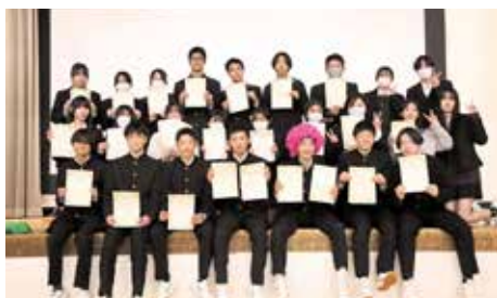
■ スピーチフェスティバル