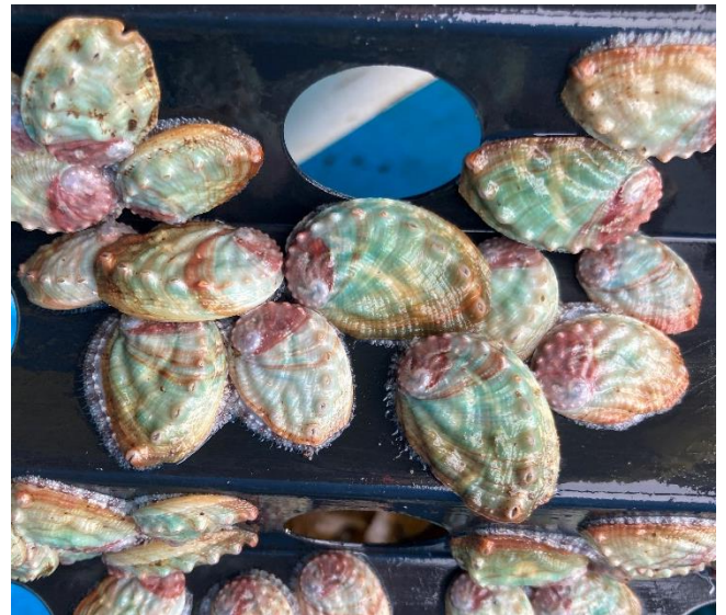
約10か月後、放流前の稚貝たち。 30mmほどにまで成長しました。