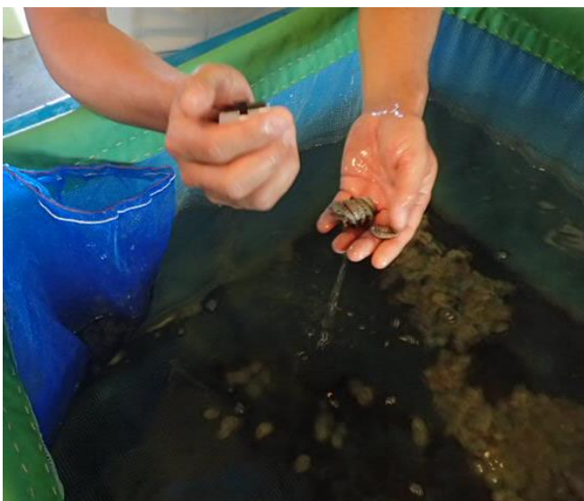
放流当日、放流個数を数えながら袋詰め。