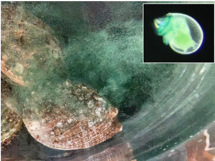
親アワビの放卵、生産開始を告げているよう・・・ (右上)孵化1日目の幼生

聞き飽きたかもしれませんが、長井地先の海は神奈川県で最も磯焼けが深刻化している地域です。それでもアワビが生息している場所があり、今回はそこへ約3000個体のアワビを放流しました。資源回復の一助となればと思います。