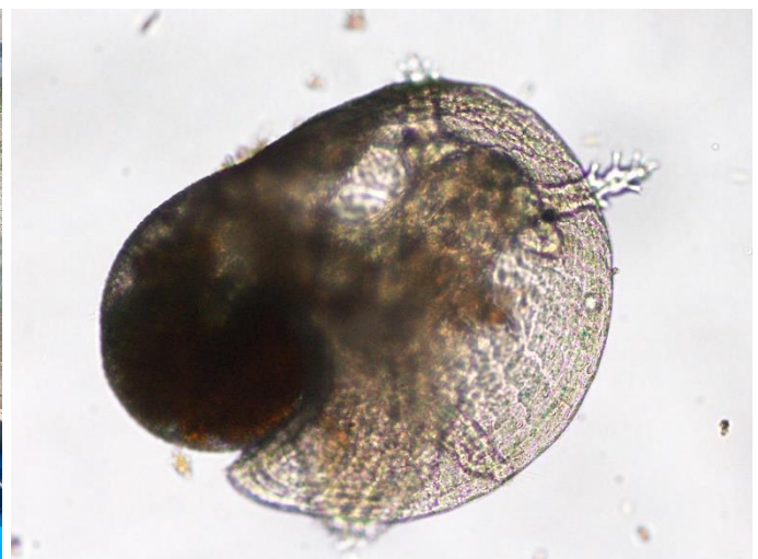
採苗から1週間後、付着生活に適した形へと殻が変化しているのが確認できました。