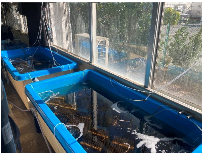
浮遊生活から着底期に入ったため、採苗を行いました（採苗についてはナマコ「採苗」を参照）