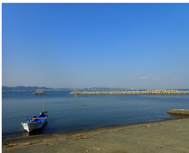
放流地の金田漁港、放流日和！