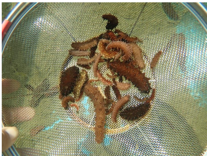
10日前に生徒たちが波板から剥離した稚ナマコたちを袋詰め

9月24（金）、快晴、風も弱く海も穏やか。とうとう本日稚ナマコたちを放流することにしました。場所は、親ナマコが棲んでいる三浦半島金田の海。いつもお世話になっている漁師さんは稚ナマコを見て、「大きく育ったね！」と言ってくれました。そして漁師さんの船で、海が荒れても影響を受けにくく、稚ナマコが隠れられる磯へ放流しました。