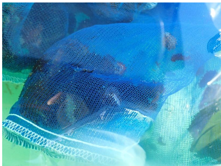
密になりすぎないように、5袋に分けて放流地へ