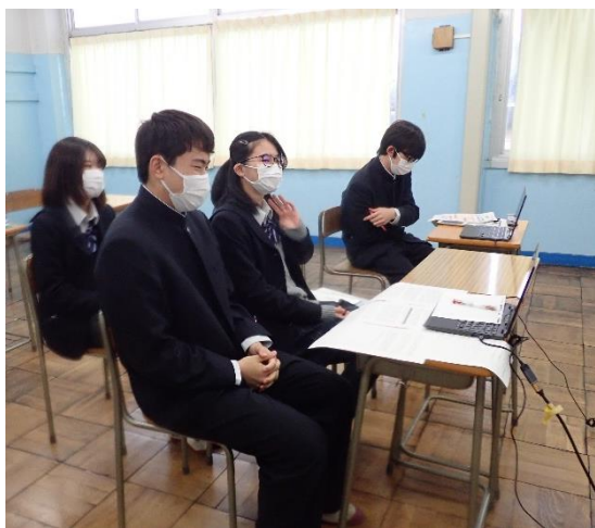
これからいよいよ発表です！

そして、カワハギグループが発表した「資源量回復を目指したカワハギ種苗生産」が最優秀賞を受賞しました！！初の快挙です！！研究経緯や概要を当学会の学会誌に掲載することになりました。