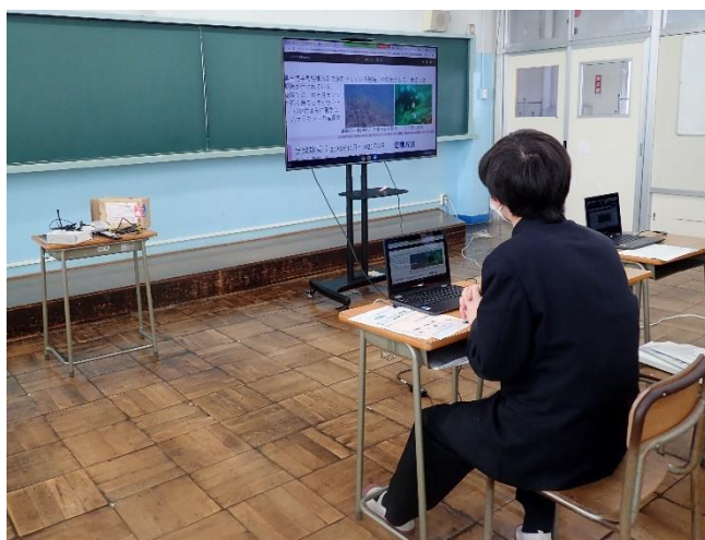
つづいて、ウニグループによる