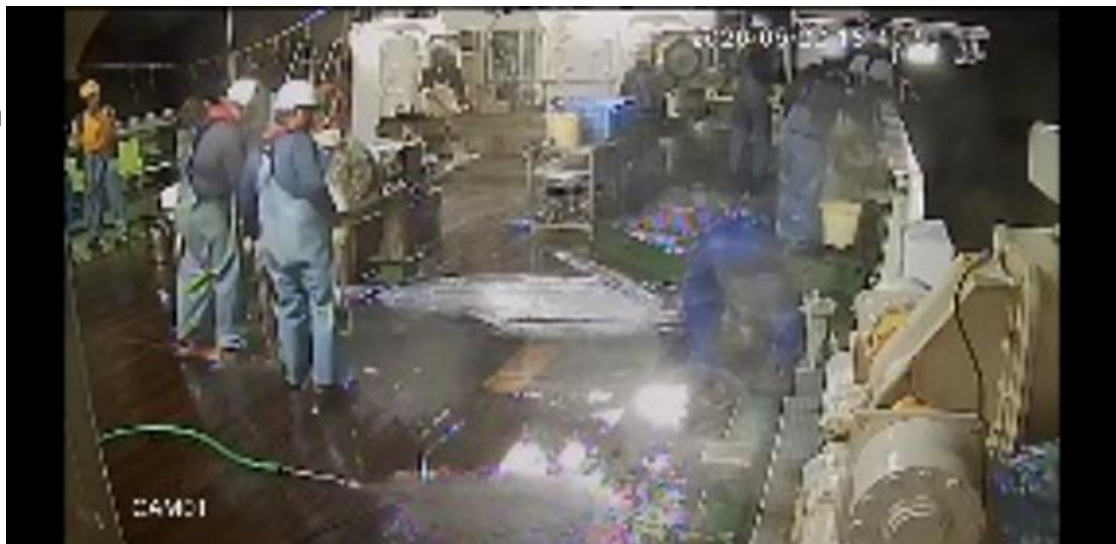
スクーパーという機械を使い船に魚を上げていきます。