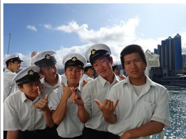
飛鳥Ⅱをバックに記念写真！→