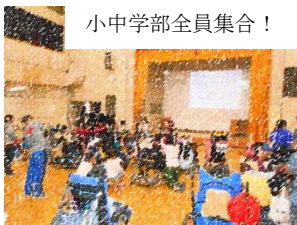
小中学部全員集合！