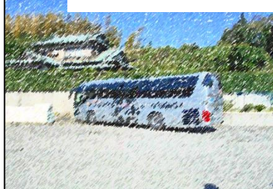
高Aの修学旅行は今年も出発式から大いに盛り上がりました

例年、第2回学校評議員会議は福祉避難所運営協議会を兼ねて運営させていただいており、今年で7回目を迎えました。本年も学校評議員の皆様、PTA役員の有志、近隣地区自治会の防災協議会の幹部の方々、鎌倉市福祉総務課、同総合防災課、同障害福祉課の各担当係長の皆様のご参加をいただき、有意義な協議ができました。今後の課題は、ミニ防災拠点（関谷小）と福祉避難所との連動性や被災者の振り分け（トリアージ）について具体的なシステムづくりに向けた合同防災訓練などプランなどを話し合いました。論より証拠。来年度は合同防災訓練の実現を図っていきたくと思っています。