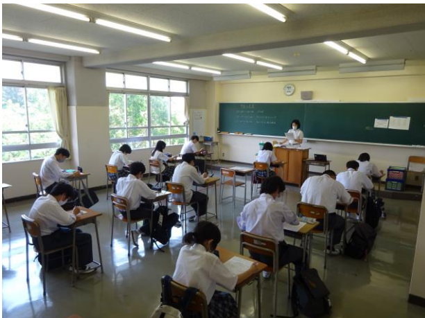
○担任が問題文を読んでいます

この日のメインも学び直し科目である『チャレンジ&ベーシックI』の授業でした。『チャレンジ』は担任が読む文章を聞き取ってプリントの穴埋めをする課題で、「人の話を集中して聞き取り理解する力を養う」ものでした。教室内はシーンと静まり返り、どの生徒も問題文の話の内容を一生けん命聞き取ろうとしていました。漢字の知識を増やすこと以外にも、社会に出てからのことを考えれば、このような課題が難くこなせるのも重要です。