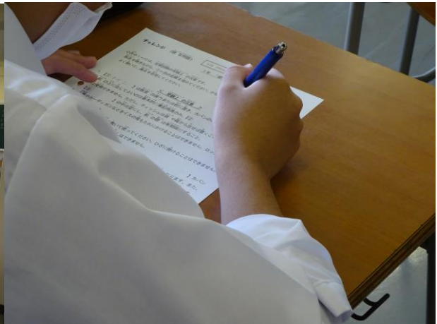
○生徒は担任の話を聞いてプリントを埋めています

一方、本来は4月から5月にかけていくつかの健診を実施していくところですが、今年度は新型コロナウイルス感染拡大防止の観点から健診を実施できる環境づくりがなかなかできません。しかしそろそろ実施可能な健診から手をつけ始める時期が来ています。前回は聴力検査を実施しましたが、この日は視力検査を行いました。卒業後就職しようとしている人たちにとって視力は大切です。メガネ等の矯正をしていないのに就職試験では通用しない視力の人も見受けられましたので、今後気になる結果の人たちを保健室に呼んで再検査をしていきます。必要を感じている人がいれば、この機会にぜひメガネやコンタクトレンズを使用するようになっ