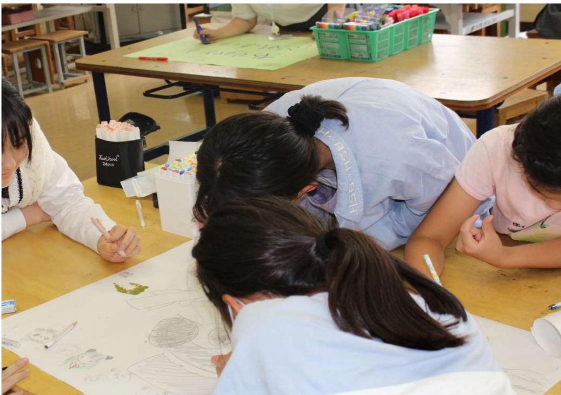
イラスト伝言ゲームのあと大きな紙にも自由に描いてもらいました。小学生の絵のクオリティの高さに驚かされました。