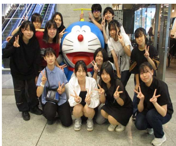
都内出版社へ訪問