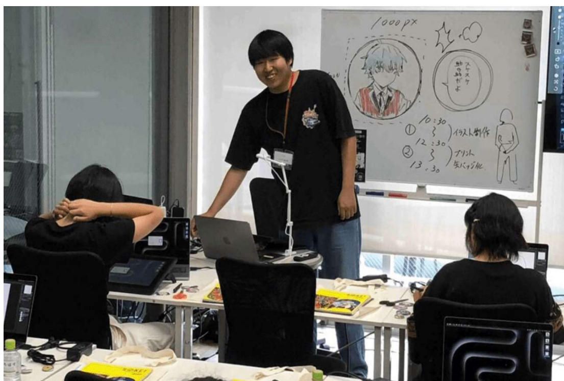
スケスケ助の助先生