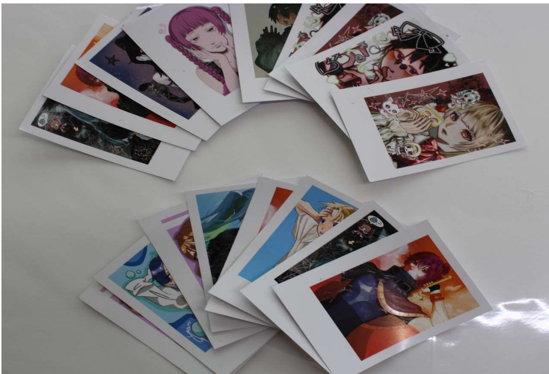
制作風景。オリジナル商品多数！