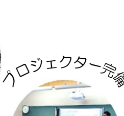
プロジェクター完備