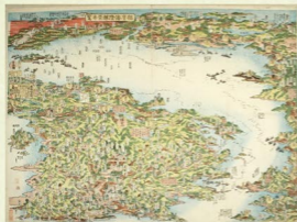
葛飾北斎画 江戸湾陸海堂寄覽

江戸時代、全国には53もの関所があり、手形を持たずに関所を避けて通ろうとする「関所破り」は死罪でした。自由な旅が難しかった庶民にとって、旅本や絵図の上での気ままな旅路は楽しかったに違いありません。