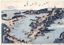
北尾重政(2世)画 西州之八景式之金沢城写図