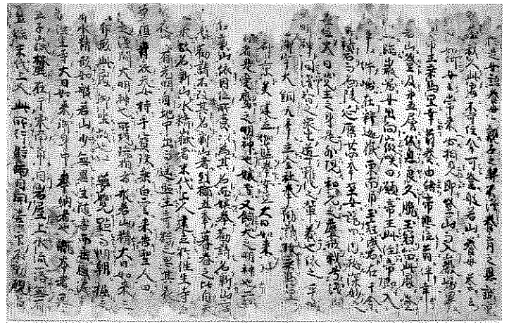
(右上から) ■国宝 鏡心日記 室町時代 ■国宝 仲文章要文 鎌倉時代 ■不動明王二童子像 南北朝～室町時代 ■国宝 富士縁起 (断簡・全海筆) 鎌倉時代 ■国宝 聖教目録 什蔵 鎌倉時代 (すべて称名寺所蔵・神奈川県立金沢文庫管理/保管)