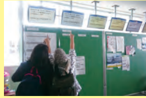
インフォメーションボード 生徒ロッカー