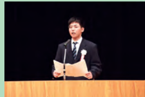
川崎市内高等学校 定時制生徒弁論大会