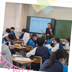
英語コミュニケーション