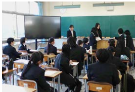
API部 (イラストレーション部)