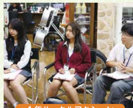
1年サークルアクション