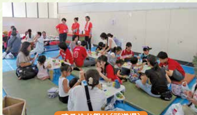
すこやか祭り(武道場)