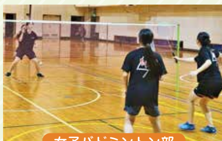
女子バドミントン部