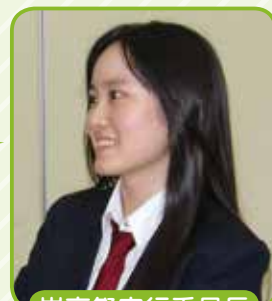
岸高祭実行委員長

文化祭（岸高祭）です。今年一番盛り上がる行事になるよう準備を始めています。生徒だけでなく、ご家族、一般の皆様にも楽しんでいただけるよう工夫を凝らしています。