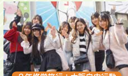
2年修学旅行：大阪自由行動