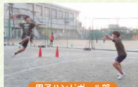
男子ハンドボール部