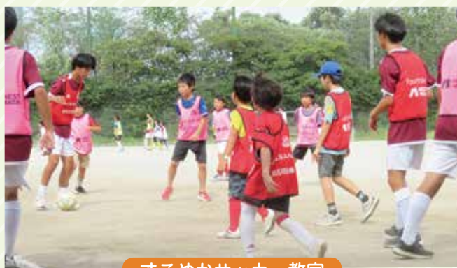
すこやかサッカー教室