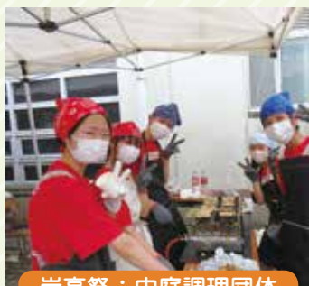
岸高祭：中庭調理団体