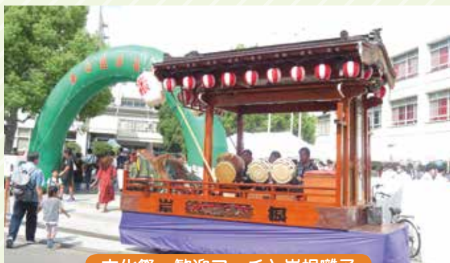
文化祭 歓迎アーチと岸根囃子