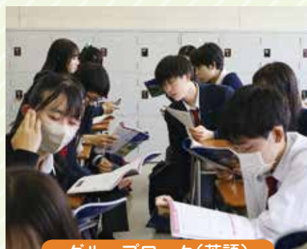
グループワーク(英語)