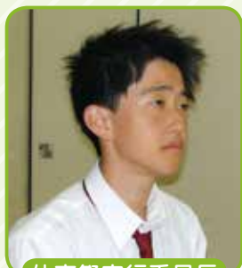
体育祭実行委員長

体育祭です。岸根高校の体育祭では4色に分かれて競い合います。特に応援団によるダンスパフォーマンスは毎年体育祭を盛り上げています。