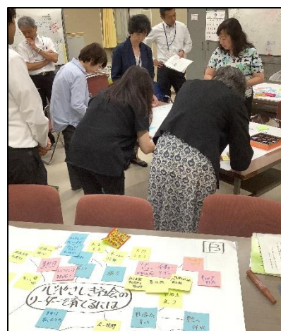
ブレインストーミングの様子