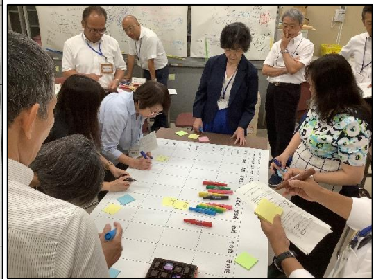
マトリクス表の作成