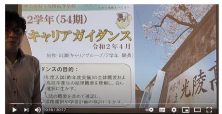
2学年キャリアガイダンス① (キャリアグループより)