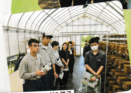
キックオフミーティングの様子