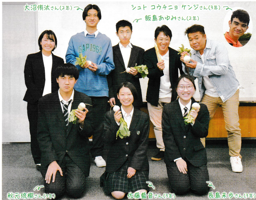
3期生メンバーとアドバイザー。収穫したカブを手にして

新時代の農業人を育成する「産農人」プロジェクトは、今期6人のメンバーで活動中。作物の生産や加工食品の開発をテーマに、学校の枠を飛び越えた実践型研修を行なっている