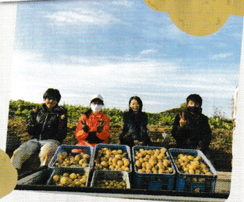
じゃがいもの収穫