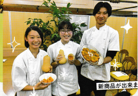
新商品が出来ました!