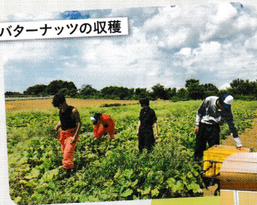
バターナッツの収穫