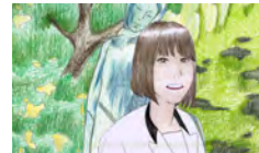
福島県立白河旭高等学校 Fukushima Prefectural Shirakawa Asahi High School