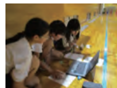
新潟大学教育学部附属新潟中学校 Niigata Junior High School Attached to the Faculty of Education Niigata University