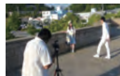
福島県立本宮高等学校 Fukushima Prefectural Motomiya High School